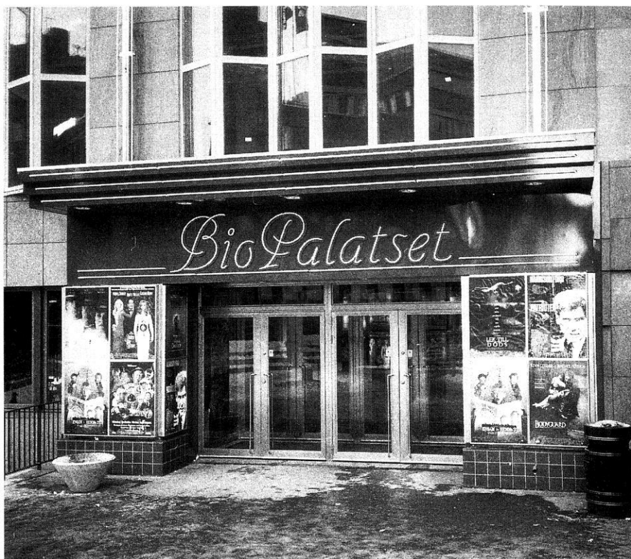
Biopalatsets entré från Folkungagatan.

välkommen med sin fackla. En kulinarisk förflyttning till Danmark gör man lätt via smörrebrödsboden där man äter en "H. C. Andersen" eller en "Dyrlægens nattamat" och läppjar på en kall dansk pilsner till.