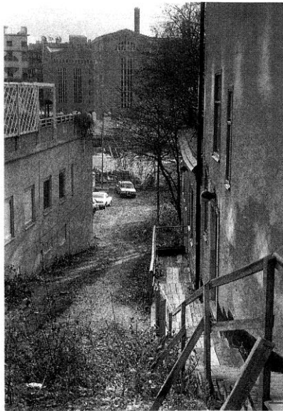
Stockholms kanske äldsta gata. Banbrinken mot söder.

I bakgrunden Södra stationsområdets nya bus hösten 1992.