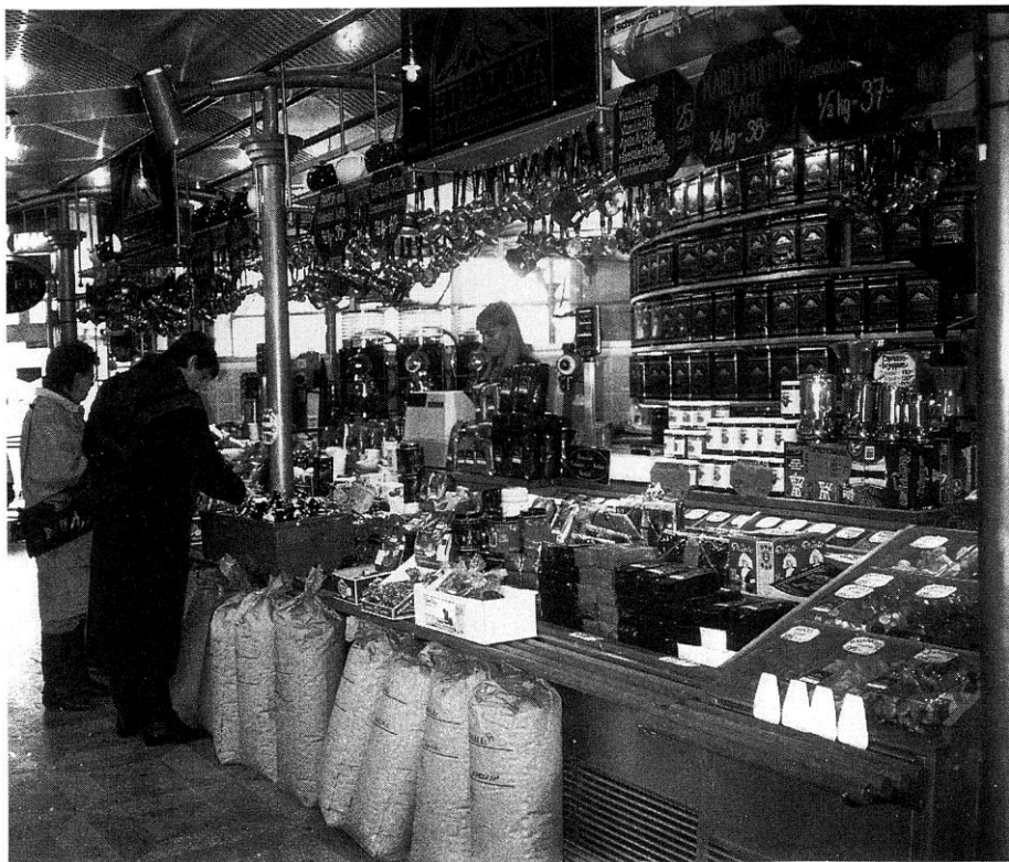
Söderballarna: Kaffe- och teboden.

Magens behov kan naturligtvis även tillfredsställas på plats, såsom i restaurangen "Pig and Whistle" där Frihetsgudinnan i mänsklig storlek hälsar dig