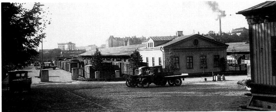
Stockholms södra godsstation 1930.