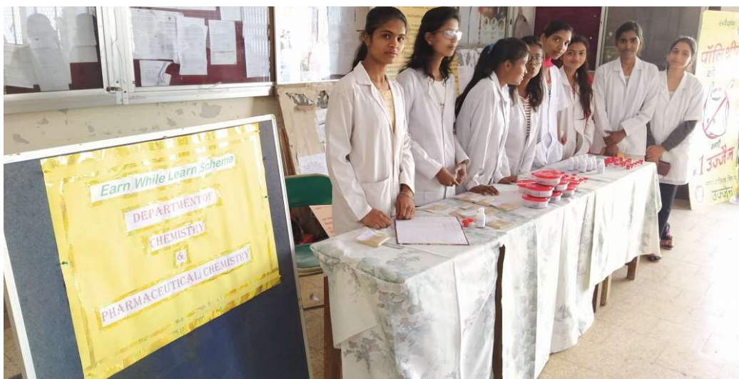
Sanitizer Donation to Class IV Employees