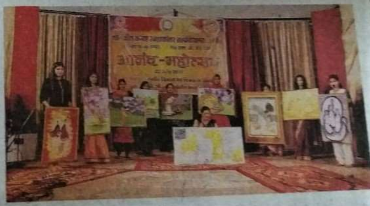
महोत्सव में बनाए चित्र प्रदर्शित करती छात्राएं।