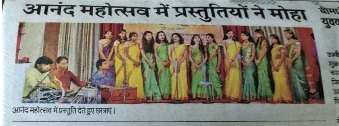
आनंद महोत्सव में प्रस्तुति देते हुए छात्राएं।