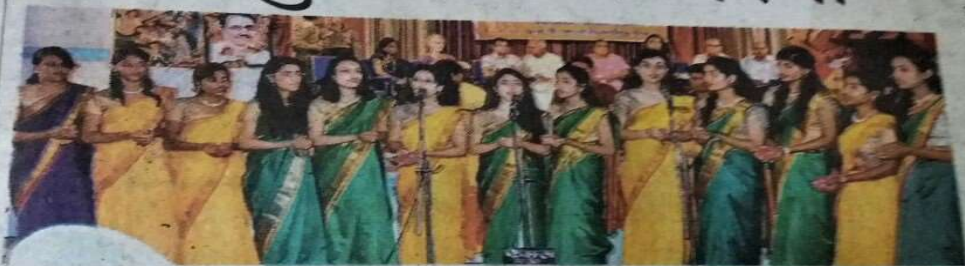
कन्या स्वातकोटर महाविद्यालय में आनंद उत्सव के तहत सांस्कृतिक गायन की प्रस्तुति देता छात्राओं का दल।