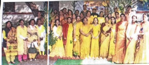
GGPGC staff members celebrating Basant Panchami while wearing yellow dresses