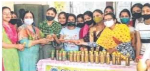
GGPGC students sell herbal products under Atmanirbhar Bharat Abhiyaan

The students of pharmaceutical chemistry prepared Lip Balm, Pain Relieving Oil, Pain Relieving Balm, Charcoal Face Soap and Hand Sanitizer in the Pharma Laboratory under the mentorship of faculty