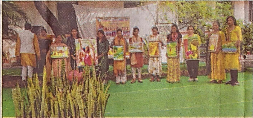
GGPGC students celebrate Basantotsava