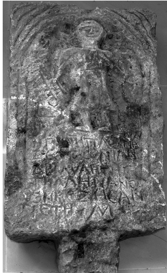
Figure 3 : Stèle funéraire probablement de Byllis

Le défunt est qualifié d'aulète, de joueur de flûte. Il faut donc renoncer à le prendre pour un militaire en arme, ou un gladiateur, d'autant plus qu'il n'est pas représenté comme un véritable militaire, en ce sens qu'il ne porte ni casque, ni cuirasse, ni cnémides. Son nom peut