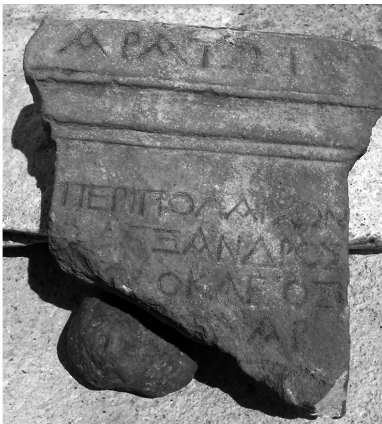
Figure 2 : inscription de Matohasanaj

Ἀράτωι. Περιπολαρχῶν Ἀλέξανδρος [Φι]λοκλέος 5 [μνήσ] χάριν [- - - - -].