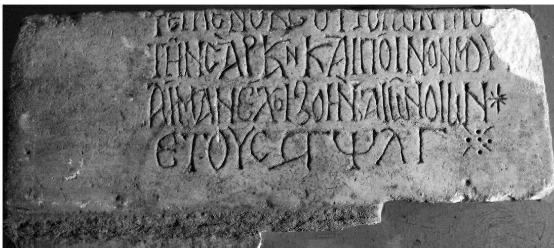
Figure 4 : inscription venant de Mesopotam

Inscription trouvée en 2014 au cours de fouilles effectuées au pied du grand mur portant la cloche du monastère, gravée sur un bloc de calcaire, brisé à droite, tandis qu'en haut la première ligne est partiellement amputée de la partie haute des lettres ; sa lecture doit beaucoup à l'aide de Miltiade Hatzopoulos ; dimensions de la pierre : longueur : 41,5 cm ; largeur : 19,3 cm ; épaisseur : 6,2 cm ; h. l. : à la première ligne : 1,5 cm ; à la deuxième ligne : 2,5 cm ; à la troisième ligne : 3,1 cm ; à la quatrième ligne : 2,5 à 3 cm