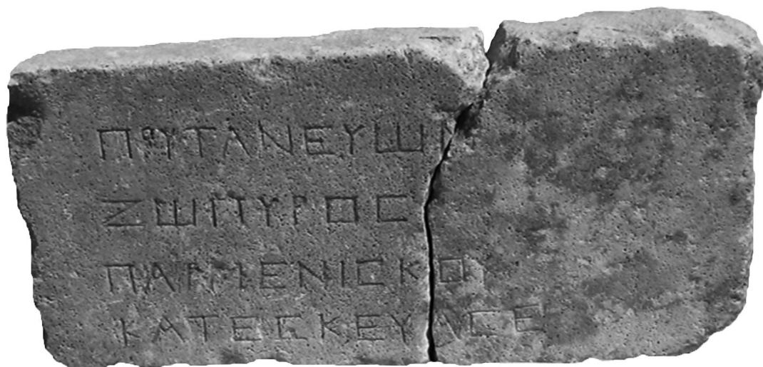
Figure 1 : inscription d'Amantia (Ploça)