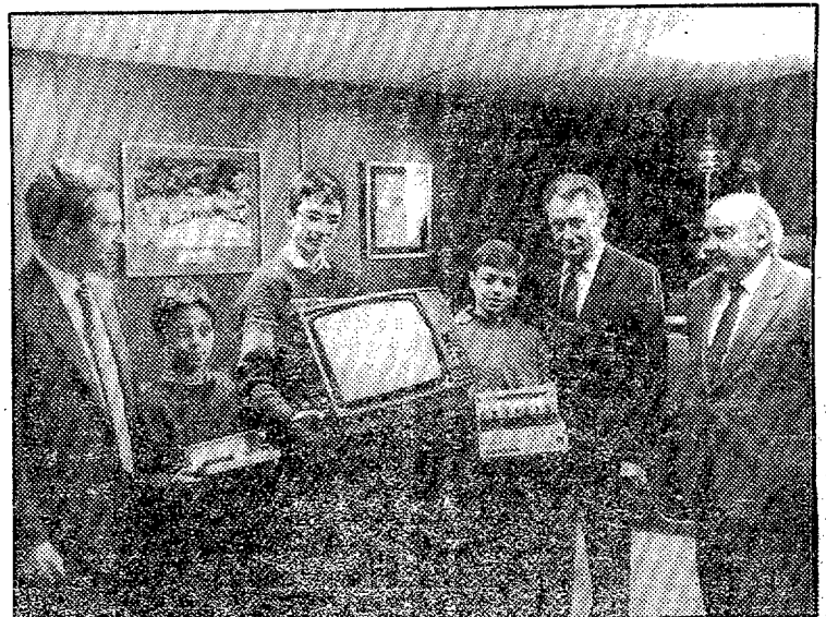
Ayer se hizo entrega de premios a los ganadores del concurso "¡Entrevista a tu idolo!", realizado durante el Salón de la Infancia y organizado por la Generalitat de Cataluña y EL MUNDO DEPORTIVO.