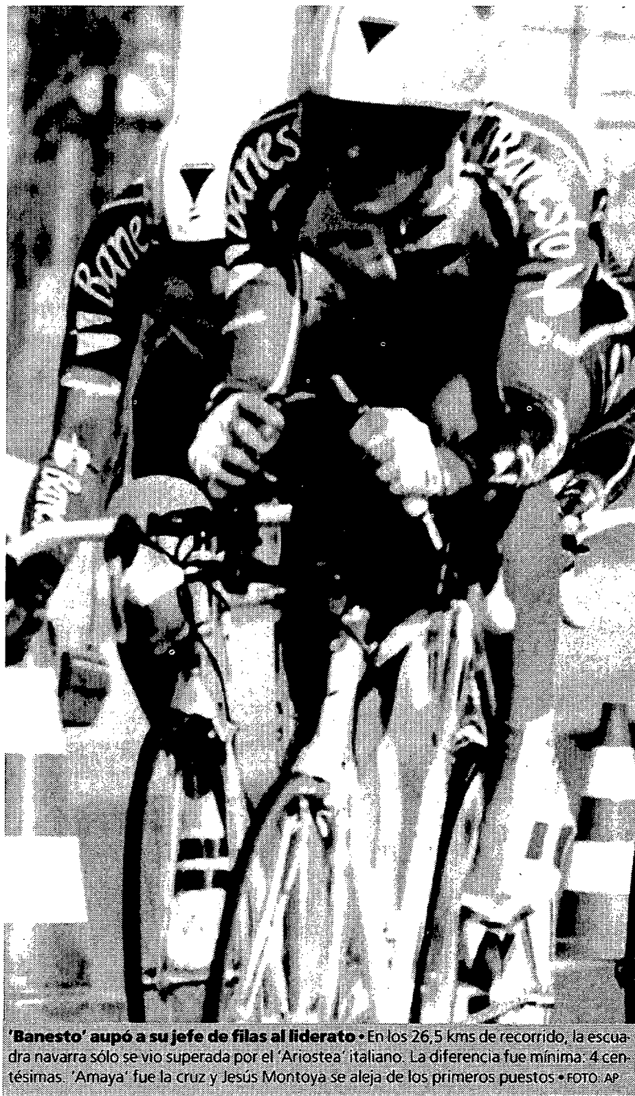
'Banesto' aupó a su jefe de filas al liderato • En los 26,5 kms de recorrido, la escuadra navarra sólo se vio superada por el 'Ariosteas' italiano. La diferencia fue mínima: 4 centésimas. 'Amaya' fue la cruz y Jesús Montoya se aleja de los primeros puestos • FOTO AP