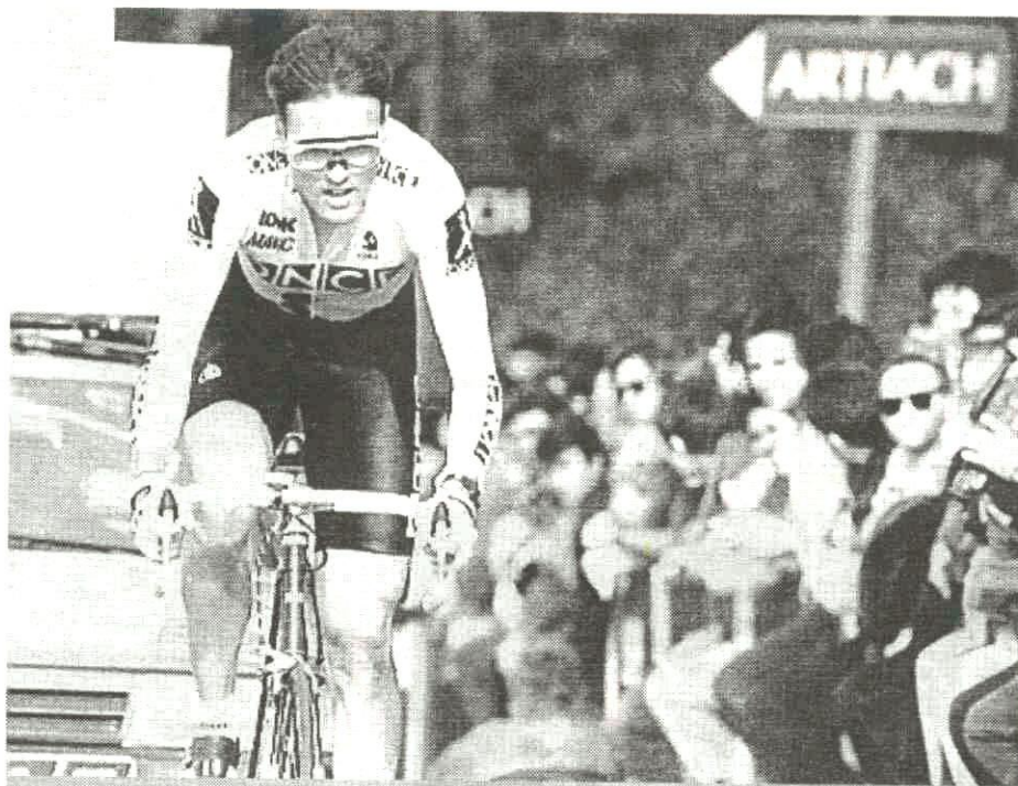
Alex Zulle vuelve por sus fueros • El suizo del ONCE es líder en la París-Niza