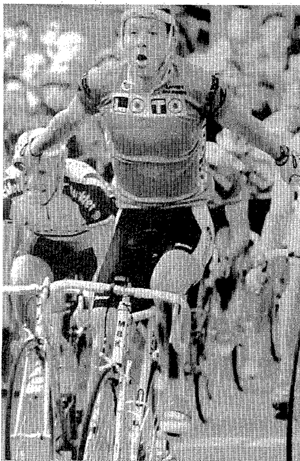
Museeuw invierte los términos • Ayer fue Cipollini quien trabajó para su compañero belga

posición de Zulle y de sus compañeros del ONCE había sido amenazada por los ataques de Bernard y De Las Cuevas en la primera hora de carrera. Zulle, descolgado en un momento