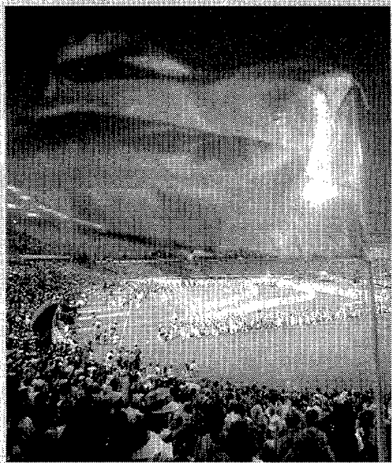
Los Juegos, en marcha • Con una vistosa ceremonia empezaron los Panamericanos

El presidente argentino, Carlos Menem, y el presidente del Comité Olímpico Internacional, Juan Antonio Samaranch, presidieron la ceremonia inaugural de los XII Juegos Panamericanos, celebrada en el estadio de fútbol Ciudad de Mar del Plata ante unas 30.000 personas. Con sus brazos en alto y un gesto unánime de alegría, los deportistas hicieron poner en pie al público durante varios minutos y provocaron aplausos y vivas desde todos los sectores del estadio. El presidente argentino, Carlos Menem, inauguró oficialmente los