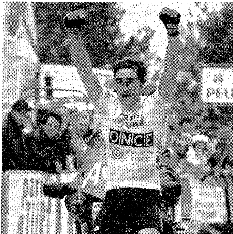
Laurent Jalabert, más líder • Ayer volvió a ganar la etapa en solitario •

L aurent Jalabert volvió a dejar clara su superioridad por segundo día consecutivo. El corredor francés, jefe de filas del ONCE, ganó de nuevo la etapa y se reafirmó en el liderato de la París-Niza.