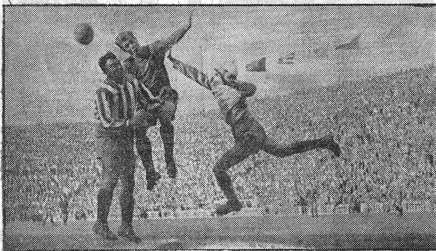
Del partido Barcelona - Gijón del pasado domingo en Las Cortes. — Vila, que puso en evidencia su peligrosidad ante el marco, en un salto magnífico, consigue pasar el balón con la cabeza a su ala derecha, a pesar del acoso del defensa y del portero gijonés. — (Foto. Claret)

Henos aquí ya metidos de lleno en los azares de la Liga, con una nueva jornada que es interesante y hasta cierto punto decisiva, des-