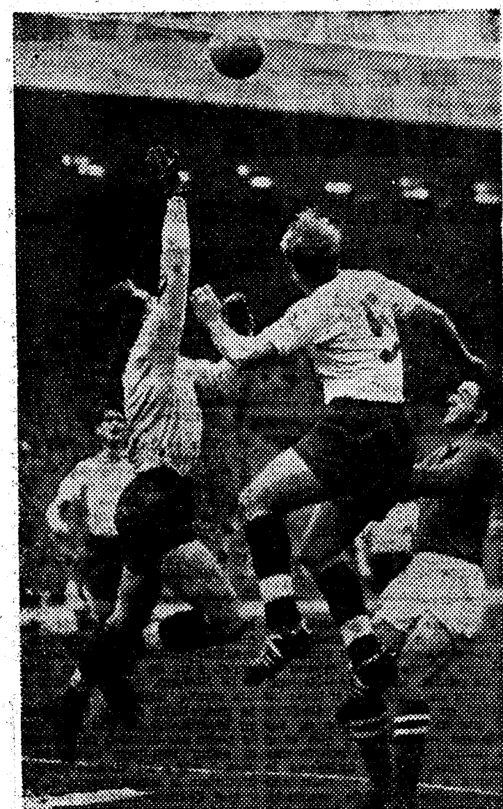
El meta Yashine, una de las grandes figuras del fútbol ruso, cuya participación en la próxima edición de la Copa de Europa de clubs se da como segura

En encuentros amistosos han batido a todos los clubs finalistas del torneo, excepto a los españoles, con los que no han jugado