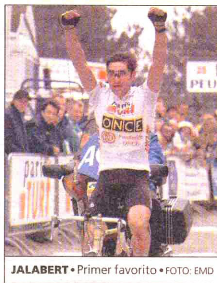
JALABERT • Primer favorito •

Al margen del tándem que hace las delicias de los aficionados del país anfitrión, el belga Johan Museeuw, impresionante en estos comienzos de temporada, el cuarteto suizo Rominger, Dufaÿx, Giannetti y Richard, y quizás el ruso Berzin, son firmes as-