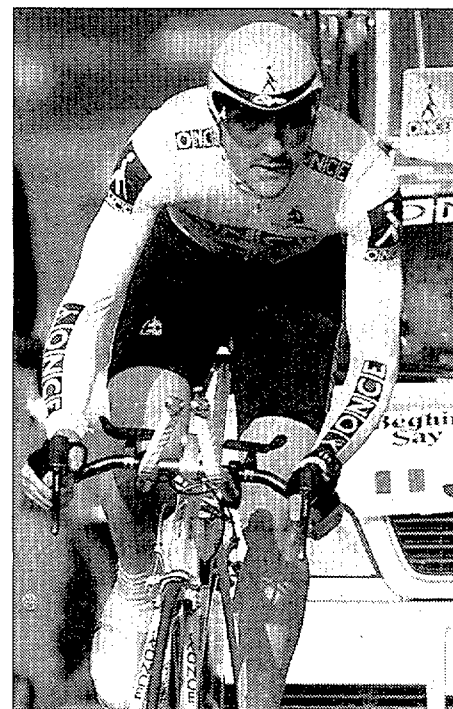
LAURENT JALABERT • Se llevó la primera victoria en la París-Niza

tipo de sospecha de incurrir en doping a causa de EPO. Los responsables del control efectuado, que no revelaron los nombres de los corredores analizados, permitieron tomar la salida a los cuatro, lo que se tomó como señal de que todo estaba en orden.