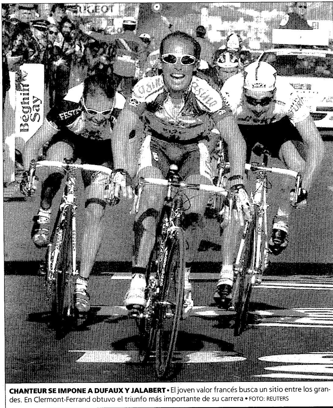
CHANTEUR SE IMPONE A DUFAUX Y JALABERT • El joven valor francés busca un sitio entre los grandes. En Clermont-Ferrand obtuvo el triunfo más importante de su carrera

En cuanto a la polémica desatada por los controles de sangre a 36 corredores efectuados durante los dos primeros días de carrera con el resultado de tres ciclistas sancionados, la UCI ha salido al paso diciendo que tanto equipos como corredores apoyan la medida y colaboran con ella.