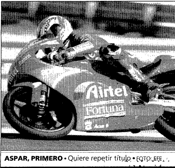
ASPAR, PRIMERO • Quiere repetir título • FOTO: EFE

La jornada se disputó con un tiempo primaveral y 'As-