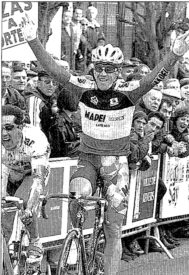
STEELS NO DISIMULA SU ALEGRÍA • Consiguió en Nevers su quinta victoria esta temporada