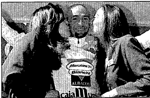
PANTANI • Está en el buen camino

El gran aliciente de la jornada estribaba en saber si el leonés, vencedor en Andalucía y líder en Mur-