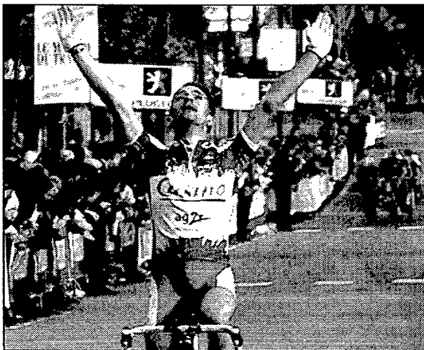
ROUX • El francés se impuso en la meta de Vichy

Ya se sabe cómo es la vida en las grandes ciudades. Correr, correr y correr.