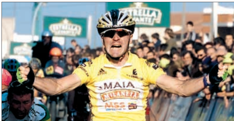
Edo dejó ir toda su euforia tras ganar la cuarta etapa de la Vuelta a Murcia después de ser batido en las dos etapas anteriores por Sacchi

La 'course au soleil' (carrera al sol), como se la conoce en Francia, era el último reducto de prestigio en el mundo ciclista que no había caído en manos de la Société du Tour. La grave crisis económica de la carrera -la TV pública francesa no la transmite, con lo que se hace más duro captar sponsors- abocó a Laurent Fignon, propietario de la prueba desde 1999, a la rendición. Tras estar a punto de desaparecer, la organización del Tour compró la prueba de 69 años de historia. Pero han impuesto que el maillot de líder sea amarillo, en lugar del blanco tradicional ●