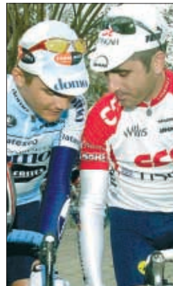
Virenque y 'Jaja', entre los favoritos

Los equipos sin plaza en el Tour y que aspiran a participar tendrán una primera revalida ante los organizadores. Son cinco escuadras francesas las que quieren estar en la gran cita de julio y no tienen plaza asegurada. Correrán cuatro equipos españoles: ONCE, iBanessto.com (Pascual Rdgez.), Kelme y Euskaltel ●