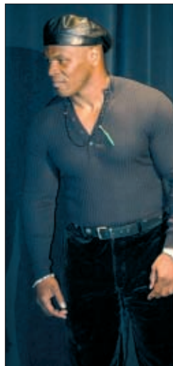
Tyson, cuerdo. Los test psicológicos, clave AP

En caso de que el combate no hubiese hallado escenario en EE. UU., varias ciudades de todo el mundo (Panamá, Bucarest, Corea del Sur, Bahamas, Grecia, México o Madrid) aspiraban a servir de marco a la pelea. ●