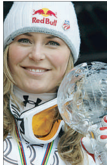
Lindsey Vonn remató ganando en Are

Walchhofer ganó el título de descenso porque su compatriota Klaus Kroll, a 75 puntos en la general, sólo pudo ser sexto •