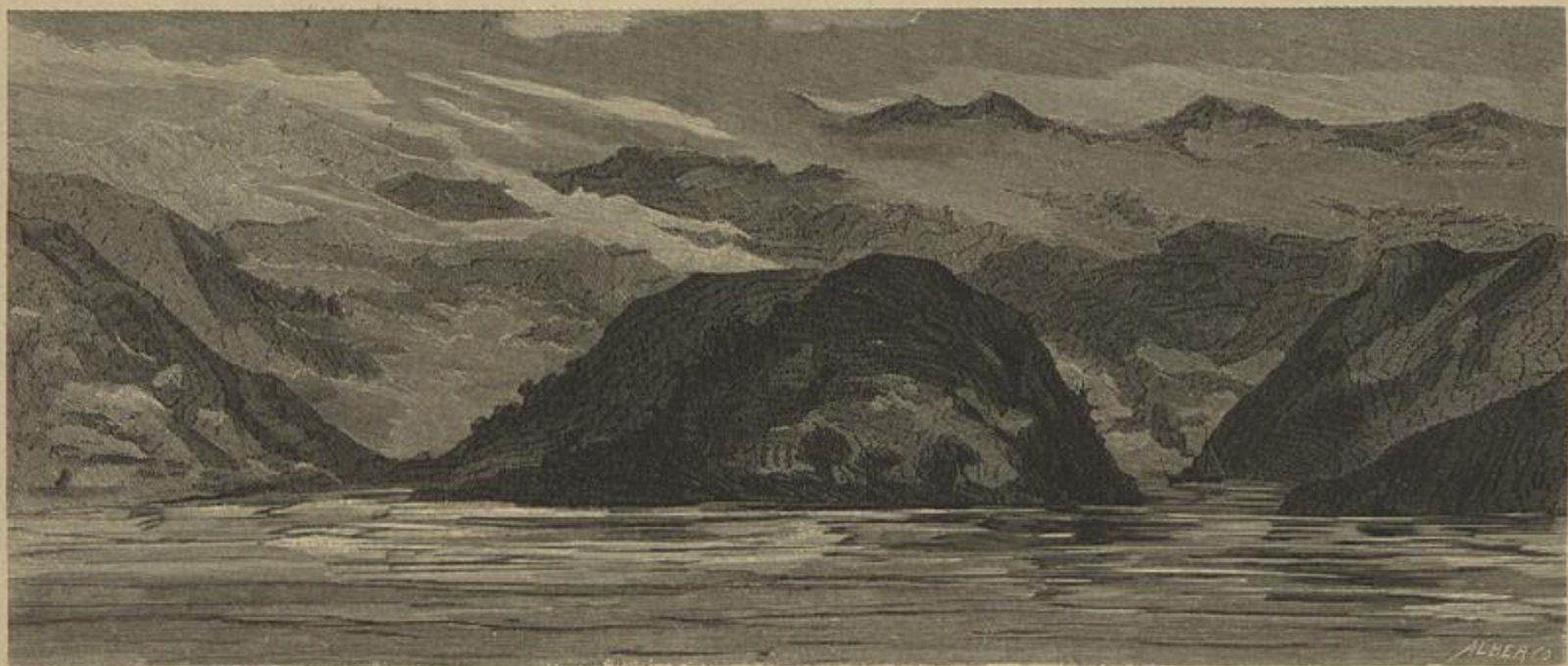
OS REDOMINHOS DE FUMA-FUMA, NO ZAIRE

por da água em ebulição, evocavam n'este, não sómente a veia poética como tambem o éstro musical.