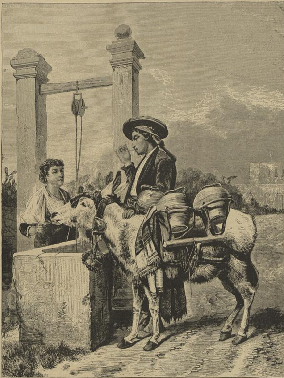
COSTUMES HESPAÑOES — UM AGUADEIRO DE GRANADA

Assim decorreu um anno. Os ladrões das im-