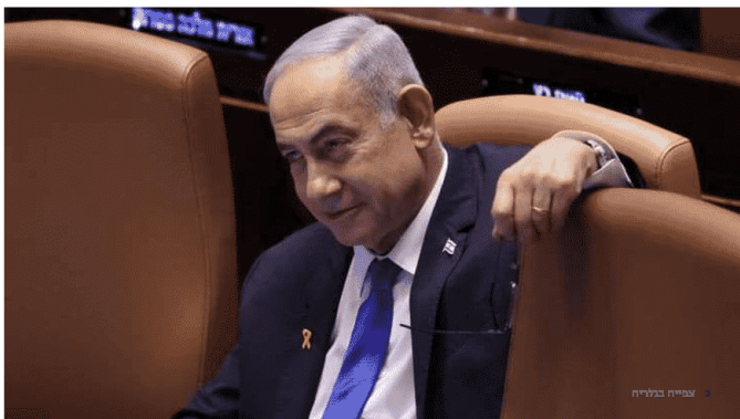
בנימין נתניהו

סרט דוקומנטרי חדש בשם The Bibi Files, מבית היוצר של המפיקה האמריקאית זוכה פרס האוסקר אלכס גיבני, מבטיח להפיל פצצה פוליטית שעשויה לטלטל את מסדרונות בלפור. הסרט בן השעתיים, שיוקרן בשבוע הבא בהצגת בכורה בפסטיבל הסרטים הבינלאומי של טורנטו (TIFF), חושף קטעי חקירות משטרתיות שטרם נראו של ראש הממשלה בנימין נתניהו, אשר נאספו כחלק מהחקירות נגדו באשמות שוחד, מדמה והפרת אמונים. כידוע, לפי החוק בישראל - הקלטות של חקירות אסורות בפרסום ללא אישור בית המשפט. כיוון שהסרט יוצר ומוקרן מעבר לים - ספק אם החוק תקף, אולם בארץ תעלה שאלה חוקית אם מותר לשדר.