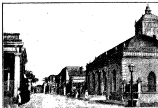
Kongensgade med Korskirken

Adskillige Landsmænd har fundet deres sidste Hvilested paa disse Øer, og der er ethvert Spor af vore Foretagender udsløttet, maaske paa nær Batteriskansen ved Nankowryhavnen.