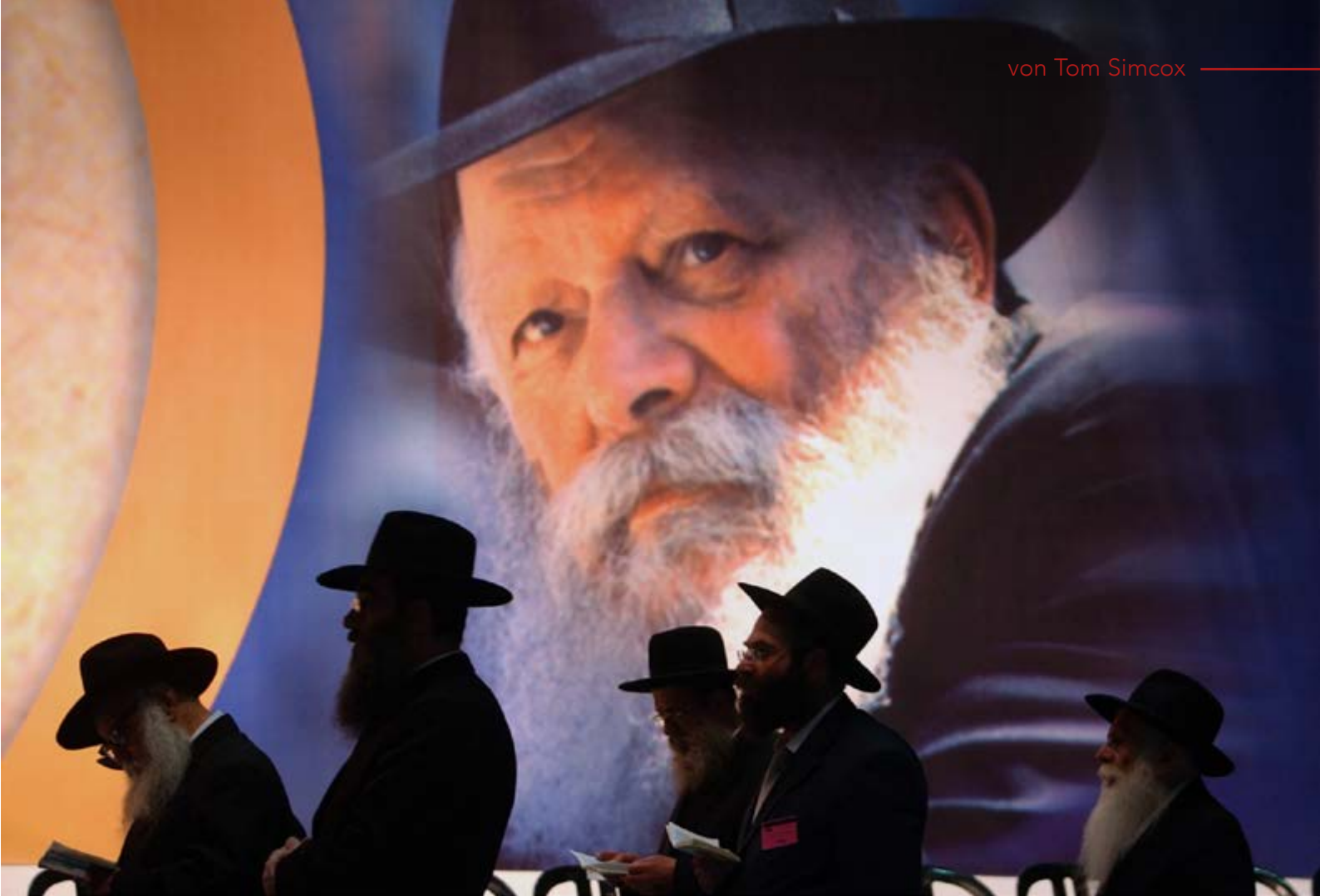
Poster von Menachem Mendel Schneerson in Tel Aviv zur Gedenkfeier des zehnten Jahrestags seines Ablebens.

gebären“ (Offb 12,1-2). Israel leidet Schmerzen und versucht, den Messias zu gebären. Diese Prophetie wird endgültig erfüllt werden, wenn „der Sohn, das männliche Kind, der alle Nationen hüten soll“ (V. 5) zurückkehrt, um Sein nie endendes Königtum zu errichten.