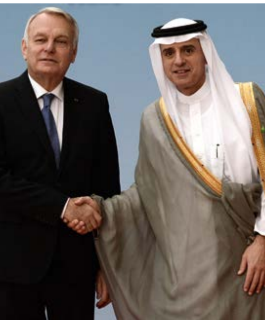
Jean-Marc Ayrault (links) und der saudische Außenminister Adel al-Dschubeir bei einem internationalen Treffen im Sommer dieses Jahres. Die Pariser Konferenz sollte dem israelisch-palästinensischen Friedensprozess neuen Schub verleihen.