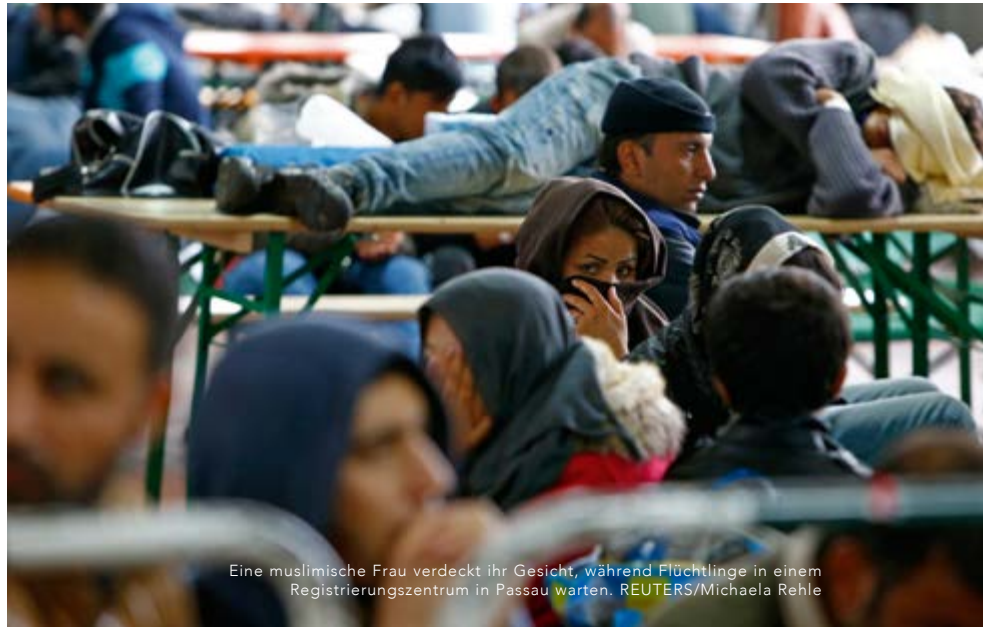
Eine muslimische Frau verdeckt ihr Gesicht, während Flüchtlinge in einem Registrierungscenter in Passau warten.

Die meisten Christen in den Heimten sind vom Islam konvertiert und kommen aus dem Irak, Syrien und