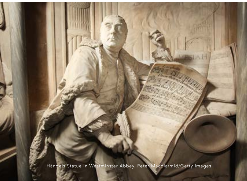
Händels Statue in Westminster Abbey.

Der Schluss enthält vier Wahrheiten: die Himmelfahrt (Ps 24), die Verkündigung des Evangeliums (Ps 19,4; Jes 52,7), die Verwerfung des Evangeliums (Ps 2,1-4) und Gottes Macht über Seine Feinde (V. 9). Bei der ersten Aufführung des „Messias“ in London am 23. März 1943 soll sich König George II während des „Halleluja-Chors“ von seinem Sitz erhoben haben, was alle anderen veranlasste, ebenfalls aufzustehen. Manche sahen seine Handlung als Hinweis darauf, dass er Christus als König der Könige anerkannte. Seitdem ist es in London üblich, dass die Zuschauer während dieses Chors stehen.