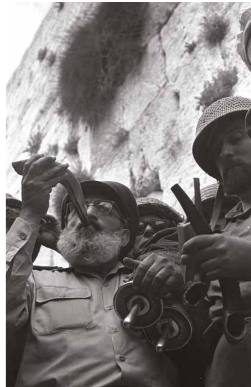
Der von Soldaten der Verteidigungstreitkräfte umringte Armee-Oberrabbiner Schlomo Goren bläst das Schofarhorn vor der Westmauer.

Die Folterungen und das Blutvergießen in den dunklen Jahren der katholischen Inquisiti-