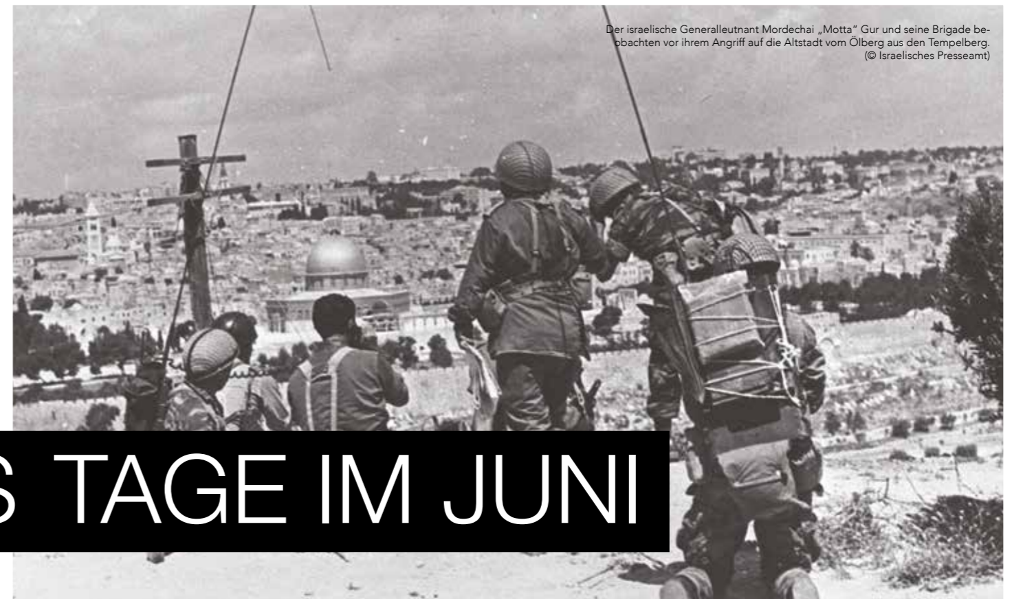
Der israelische Generalleutnant Mordechai „Motta“ Gur und seine Brigade beobachten vor ihrem Angriff auf die Altstadt vom Ölberg aus den Tempelberg.

AM 7. JUNI JÄHRT SICH DER TAG DER WIEDERVEREINIGUNG JERUSALEMS ZUM 50. MAL. HIER BETRACHTEN WIR DEN ARABISCH-ISRAELISCHEN KRIEG VON 1967, DER DEN JÜDISCHEN STAAT VOR DER VERNICHTUNG BEWAHRTE UND GOTTES EWIGE STADT WIEDERHERSTELLTE.