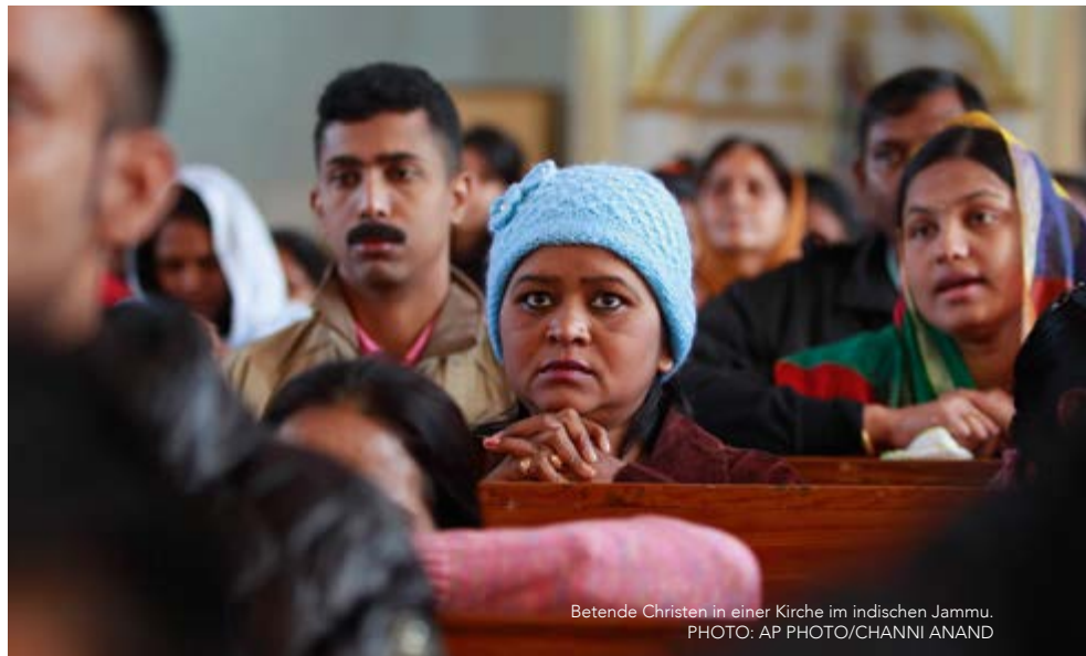
Betende Christen in einer Kirche im indischen Jammu.