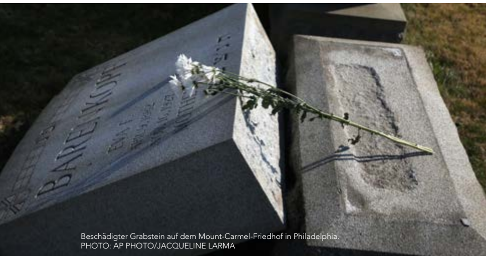
Beschädigter Grabstein auf dem Mount-Carmel-Friedhof in Philadelphia.

Ist Ihnen schon einmal aufgefallen, mit welcher Begeisterung die Welt das jüdische Volk hasst? Es ist nichts Neues. Antisemitismus gibt es schon seit der Zeit des Alten Testaments. Doch seine Zunahme in heutiger Zeit ist alarmierend, besonders in den Vereinigten Staaten und Europa.