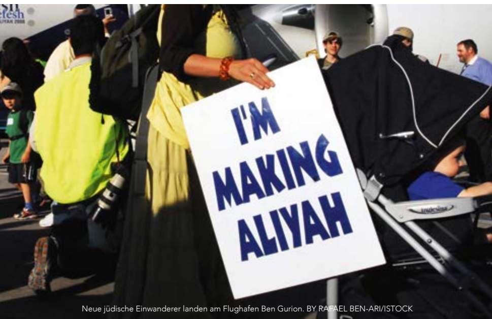
Neue jüdische Einwanderer landen am Flughafen Ben Gurion.

A uf unserer FOI-Jerusalemreise im Frühling besuchten wir die Zentrale der Jüdischen Agentur für Israel in Jerusalem und übergaben Spenden, die jüdischen Menschen in anderen Teilen der Welt helfen sollen, Alijah zu machen. „Was ist Alijah?“ fragen Sie. Im Hebräischen bedeutet es „aufsteigen“ und bezeichnet die Rückkehr jüdischer Menschen in das Verheißene Land ihrer Vorfahren.