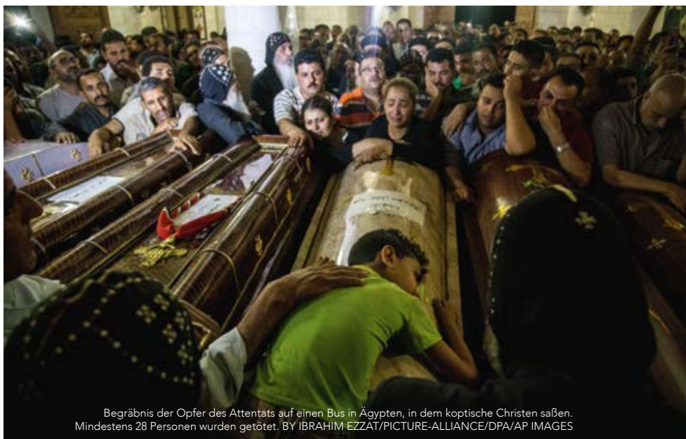
Begräbnis der Opfer des Attentats auf einen Bus in Ägypten, in dem koptische Christen saßen. Mindestens 28 Personen wurden getötet.

El Shafies Geschichte ist eine von vielen, die in der neuen Dokumentation des Clarion-Projekts „Faithkeepers“ vorkommt. Der Film,