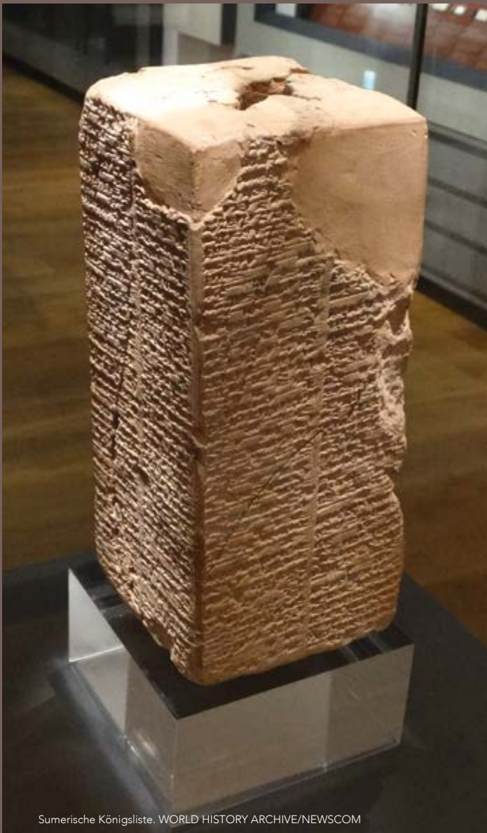
Sumerische Königsliste.

N icht religiöse Menschen und Bibelkritiker greifen die Glaubwürdigkeit der Bibel aufgrund der dort genannten langen Lebenszeiten der Menschen vor der Sintflut an. Sie behaupten, solche Lebenszeiten seien unrealistisch und nur durch den Einfluss der Mythologie auf den biblischen Bericht zu erklären. Doch wir können die Zuverlässigkeit der Bibel gegen solche Behauptungen schützen, indem wir die Archäologie zu Rate ziehen. Archäologische Entdeckungen und die antike Literatur zeigen, dass viele säkulare Kulturen der Antike ebenfalls über lange vorsintflutliche Lebenszeiten berichten.