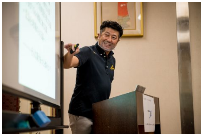
シクロクロス研修会 座学 アンチドーピング講習