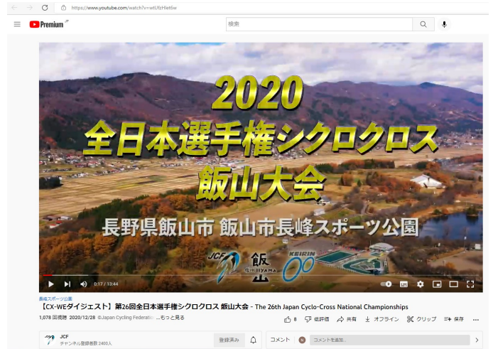
女子エリートダイジェスト版