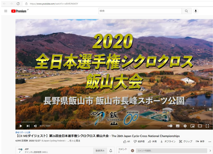
男子エリートダイジェスト版