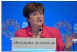
IMF giữ nguyên dự báo tăng trưởng kinh tế toàn cầu trong năm 2021