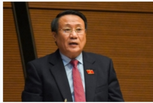
Mục tiêu tăng trưởng GDP trên 6% gặp thách thức