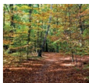
Okładka fot. Sławomir Badurek

poniedziałek 8.00-17.00 (do godz. 16.00 Dział Finansowy i Dział Praktyk Prywatnych) wtorek 8.00-18.00 środa 8.00-16.00 czwartek 8.00-16.00 piątek 8.00-13.00 (do godz. 14.00 Dział Finansowy i Dział Praktyk Prywatnych)