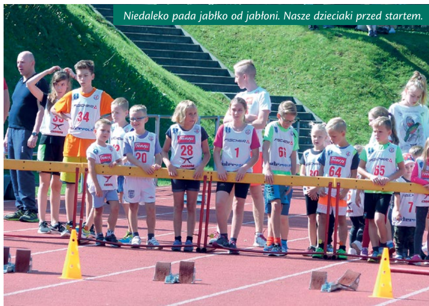
Niedaleko pada jabłko od jabłoni. Nasze dzieciaki przed startem.