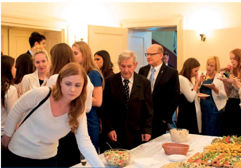
Prawa wręczone – czas na posiłek.