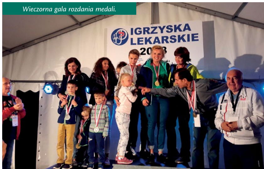
Wieczorna gala rozdania medali.