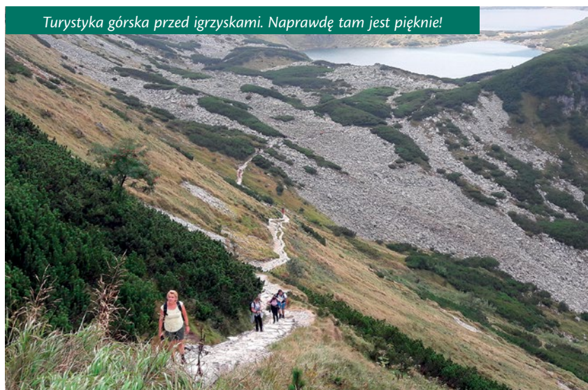
Turystyka górską przed igrzyskami. Naprawdę tam jest pięknie!