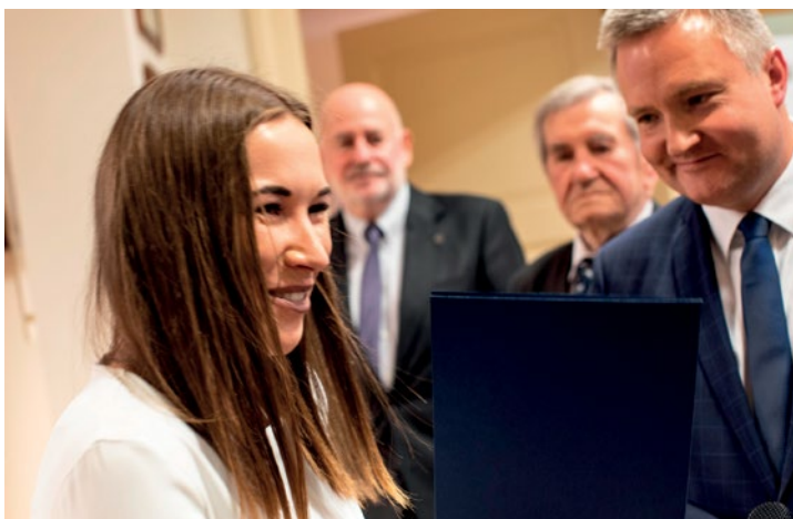
Kilka lat wytężonej nauki i... wreszcie jest!