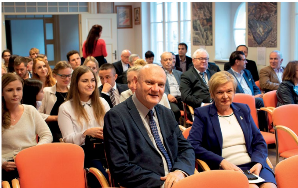
Tym razem uroczystość zaszczylił prezydent Torunia Michał Zaleski.