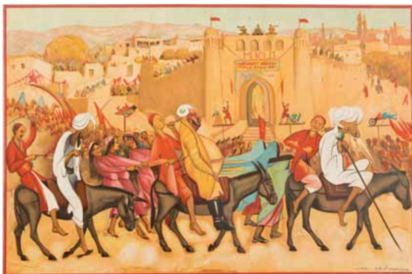
Плакат. «МЮД» (на узбекском в латинской графике и русском языках). Худ. О. К. Татевосян. Печать офсетная. Самарканд — Ленинград, 1930 г. Бумага, 45,2×60,5 см. МАЭ РАН № 4514-18.