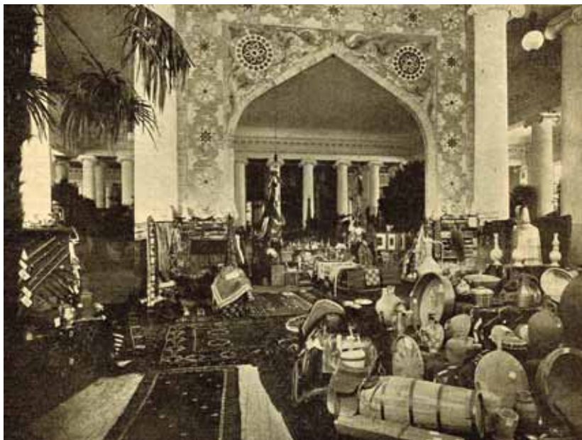
Рис. 8. Всероссийская художественно-промышленная выставка в Таврическом дворце. Азиатская часть, 1903 г. Санкт-Петербург

с годами только растет благодаря уникальному подбору экспонатов, точности предложенных атрибуций, важнейшим данным по состоянию ковроделия региона на вторую половину XIX в. и этнической карте региона. Отметим, что в составлении текстов альбома и приложенной карты принял активное участие капитан (впоследствии полковник) Ф. Михайлов. Карта была отмечена премией Всемирной парижской выставки 1900 г., а сам альбом стал не просто первой фундированной публикацией по среднеазиатскому ковроделию, но и основой для классификации туркменских ковров и одним из важнейших научных источников для исследователей этого уникального феномена евразийской культуры 1 .