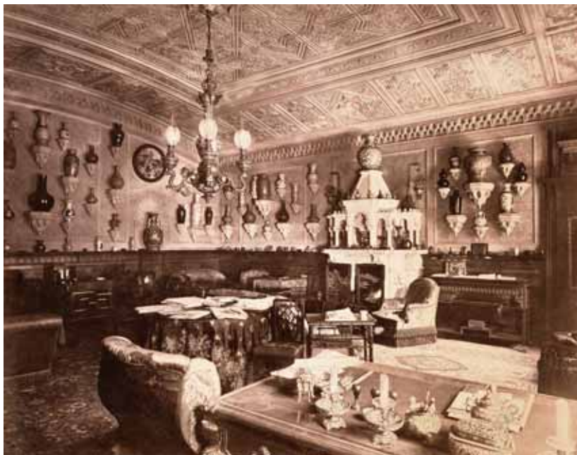
Рис. 7. Кабинет на первом этаже дома А. А. Половцева на Большой Морской улице (цит. по: humus.livejournal.com Россия в интерьерах. Ч. 2. URL: https://yadi.sk/a/e7Ck7dbc3ZQU5F /дата обращения: 25.11.2019/)

вания в России туркменских ковровых коллекций, появление которых мы можем соотнести, хотя и очень осторожно, с петровским временем 1 . Вполне очевидно, что появлению туркменских халы