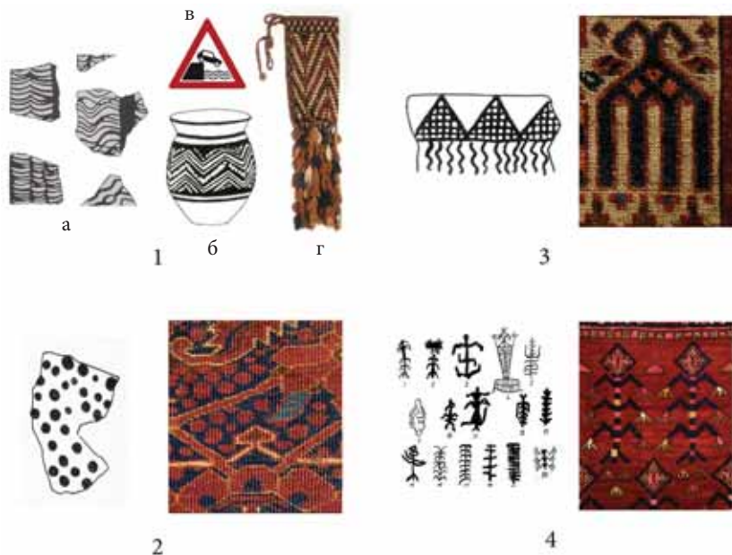
Рис. 3. Таблица рисунков на керамике позднего неолита Южного Туркменистана, петроглифах Северной Евразии и на туркменских коврах и ковровых изделиях XVIII–XIX вв.

1. Трансформация мотива струящейся воды (зигзаг): а — прорисовка фрагмента сосуда, культура Джейтун (цит. по: [Массон 1971, табл. XXXI]); б — прорисовка сосуда. Намазга-IV (цит. по: [Cassin, Hoffmeister 1988: 27]); в — обозначение дорожного знака «вперед река»; г — деталь мешка для веретен игсалик (цит. по: [Tsareva 2015, fig. X]).