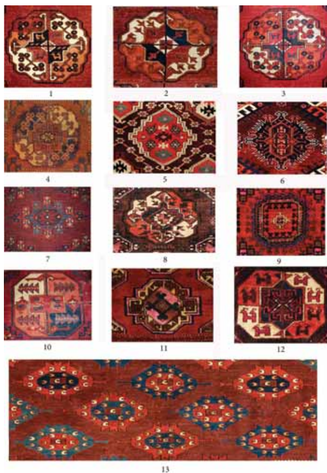
Рис. 2. Таблица туркменских племенных и общеупотребительных мотивов гэль 1. Салор-гэль (племя салор). 2. Сары-гэль (племя сарык). 3. Теке-гэль (племя теке). 4. Гюлли-гэль / кохна-гэль (племя эрсари). 5. Эртмен-гэль (племя чоудор). 6. Игл-гэль (племя имрели). 7. Капса-гэль (иомудская группа). 8. Арабачи-гэль (используется в декоре чувалов племен арабачи и чоудор). 9. Сагдак-гэль / салорская роза (используется в декоре халиче и чувалов туркмен Южного Туркменистана и Хорасана). 10. Темурджин-гэль / онурга-гэль (используется в вариантах в халы ряда племен Туркменистана и Северного Кавказа). 11. Чувал-гэль (используется в вариантах в декоре чувалов ряда племен Туркменистана). 12. Тавук / тавак-гэль (широко используется туркменами и иными ковроделами Средней Азии и Северного Кавказа). 13. С-гэль (племена иомудской группы).