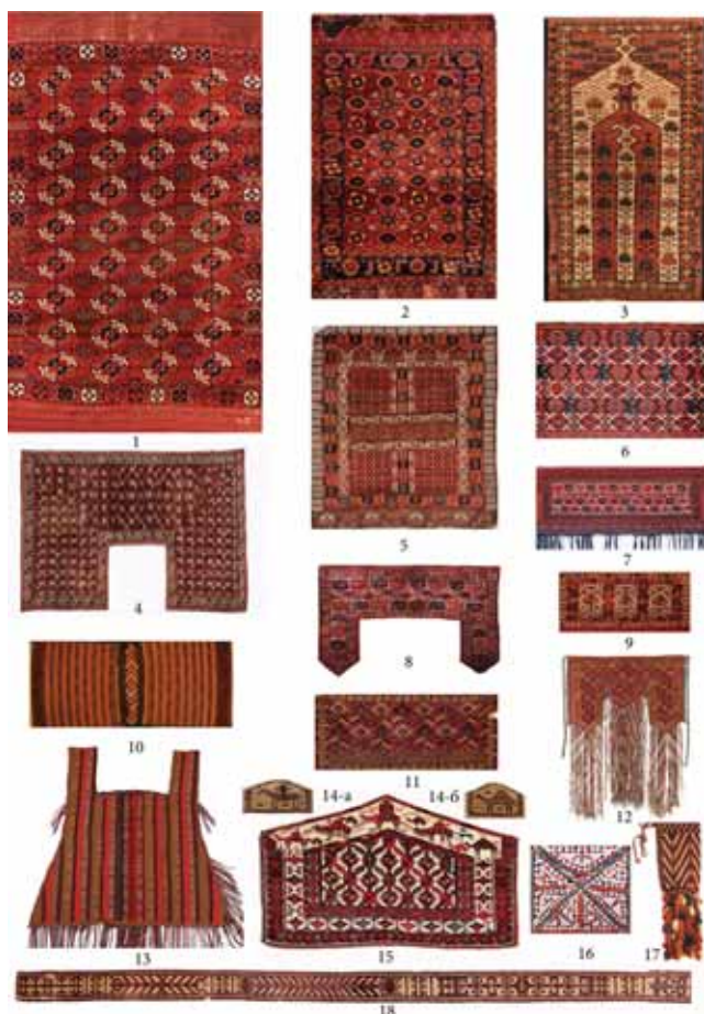
Рис. 1. Таблица основных видов традиционных туркменских ковров и ковровых изделий