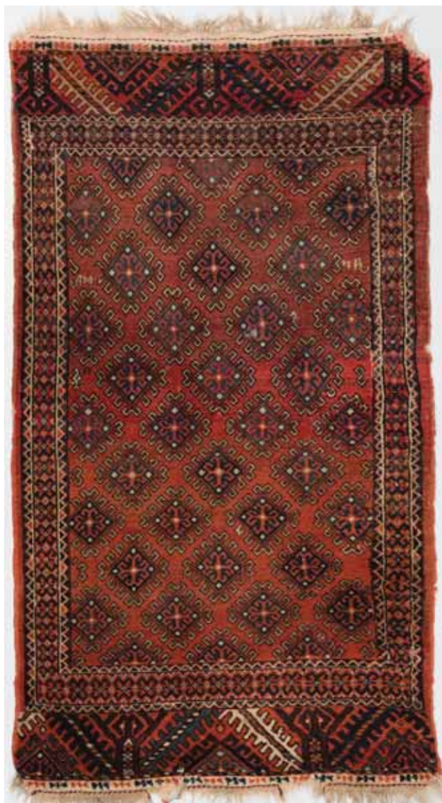
Рис. 6. Малый постилочный ковер халиче с мотивом гочак . Племя гассан-кули (Хивинский оазис). Последняя треть XIX в. МАЭ РАН, № ВХ ЭФЗК 440