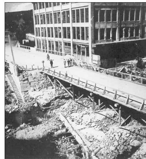
Provizorní most přes Svitavu, mezi Maloměřicemi a Obřany.