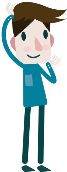
Illustration: Mangsaab - Fotolia.de

Mit der Einrichtung des Studierenden-Accounts erhalten Sie insbesondere eine eigene E-Mail-Adresse, die S-Mail-Adresse, die sich zusammensetzt aus Buchstaben Ihres Vor- und Nachnamens und auf „@smail.uni-koeln.de“ endet.