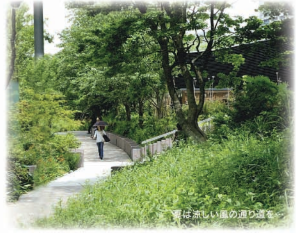
夏は涼しい風の通り道を...