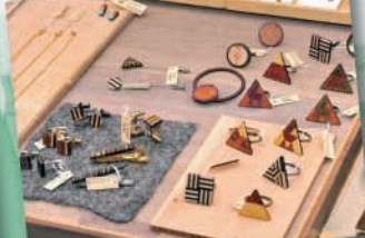
アート性の高いアクセサリ