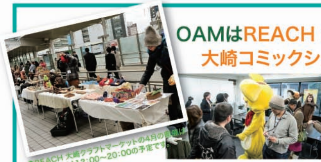
●REACH 大崎クラフトマーケットの4月の開催は4月9日(水)12:00~20:00の予定です

いつも何か生まれ、始まっている「イベントシティ大崎」へようこそ。(社)大崎エリアマネジメント(OAM)は、大崎のまちの魅力づくりに向けたこれらのイベントの開催を通じて新しい時代の大崎のまちづくりに力を注いでいきます。これからのOAMの活動にご期待ください。