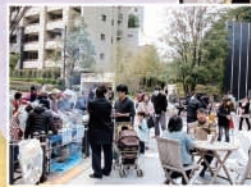
『さくらまつり』の出ものもいろいろ。お子様が喜ぶバルーンアートプレゼントや、地元有志によるバンド演奏も楽しみです。

毎年この日の西口センタープラザ(おまつり広場)は、人と屋台etc.が道を埋め尽くす「さくらまつり」恒例のメインステージに。