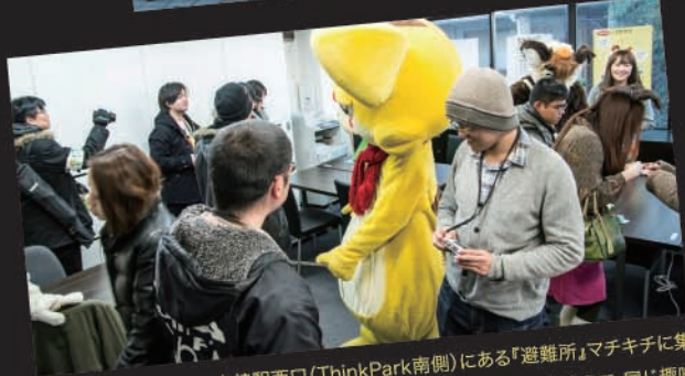
大崎駅西口（ThinkPark南側）にある「避難所」マチキチに集うコミケ参加者たち。出迎えた人気キャラも交えて、同じ趣味を持つ若者同士の交流が始まります。大崎駅前の新しい文化震源地ともなりそうな「ホット・シェルター」です。

街のさらなる活性化につなげていこうというこの試み、毎年お盆と暮れの2回、お台場会場での開催に合わせて行っていく予定です。開催中は交流と休息のスペース「避難所」や「ゆるカフェ」の他、大崎駅南口の「前線基地」テントでの飲み物のおもてなしサービス（格安販売）と周辺飲食店をガイドする「コンシェルジュ」サービスなど、システムチックな総合サービスを展開。こうした取り組みが大崎の新しい名物となる日も直近です。