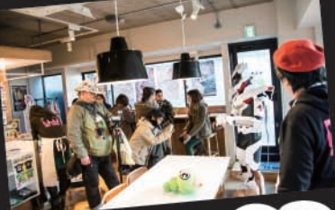
おもてなし役の若者ボランティアも大活躍