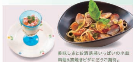
美味しさとお洒落感いっぱいの小皿料理&窯焼きピザにどうぞ期待。

絶品の本格窯焼きピザをはじめ様々な小皿料理が自慢の店。『大崎ウイズシティテラス』1Fに4月8日オープン予定の注目のカフェKITECHOでは、温泉卵のジュレなど、“ご女ごころ”をそりそりなお洒落なメニューも各種揃えました。ホッとできる優しい空間で大切な時間を過ごしたい、そんな方におすすめです。