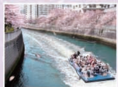
船上から見上げる桜の美しさはまた格別。約3Kmの川の花見を楽しめます。ZEAL主催で行われる人気のクルーズ。(※他に各種のクルーズあり)申込は事前予約のみ。(早々に受付終了の場合あり、詳しい内容はwebで)

目黒川の桜を船から眺める人気の乗合いお花見クルーズ。4月9日(水)まで(予定)、天王洲から大崎、五反田まで約60分をかけて満開の桜を仰ぎ見るクルージングを楽しめます。詳しい内容は左記Webサイトで確認を。