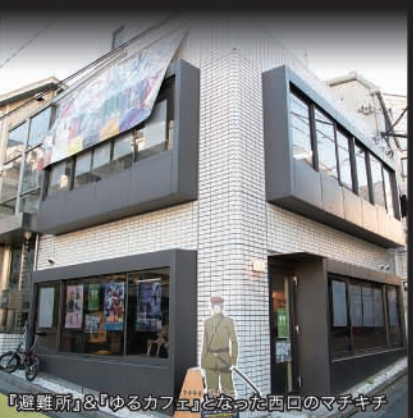
「避難所」と「ゆるカフェ」となった西口のマチキチ