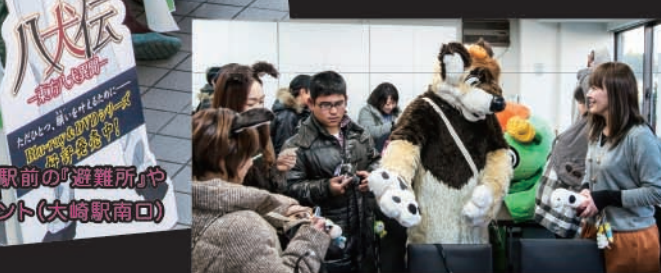
大崎を訪れるコミケ参加者のエスコート役として、大崎駅前の「避難所」や「ゆるカフェ」のお店を紹介する「コンシェルジュ」のテント（大崎駅南口）