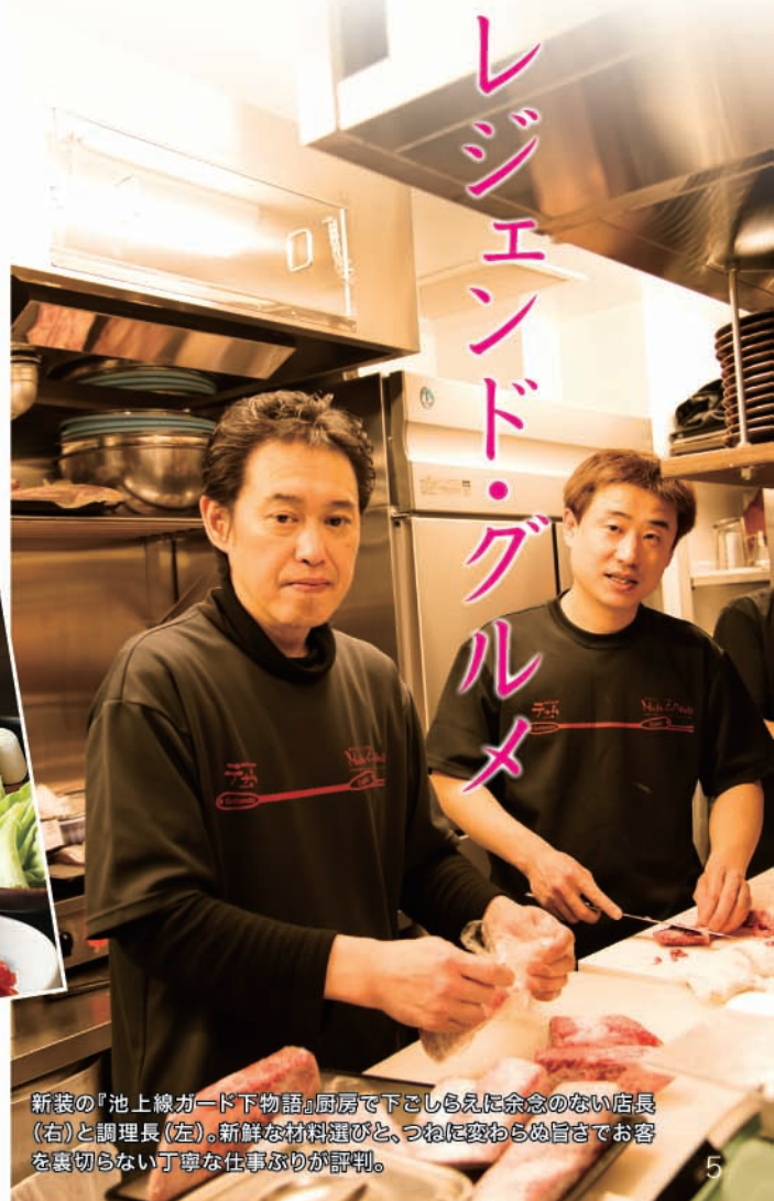
新装の『池上線ガード下物語』厨房で下ごしらえに余念のない店長(右)と調理長(左)。新鮮な材料選びと、つねに変わらぬ旨さでお客様を裏切らない丁寧な仕事ぶりが評判。