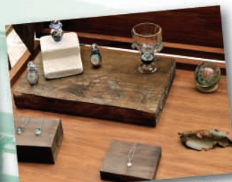
右下に紹介の『Calm Glass』の作品

『REACH 大崎クラフトマーケット』は毎月第1水曜日開催を予定しています。今後の開催(Webでお知らせします)をお楽しみに! 4月の開催: 4/9(水) 12:00~20:00