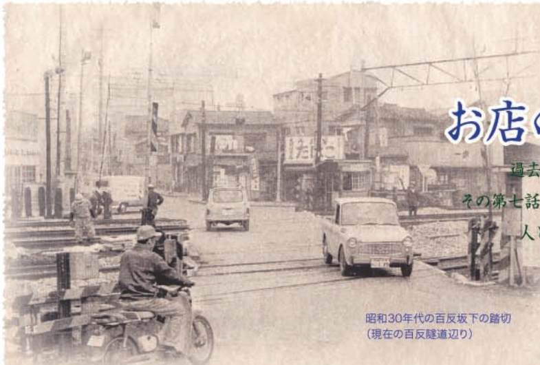
昭和30年代の百反坂下の踏切 (現在の百反隧道通り)

人と人、店、街のつながりがホットだった昭和の時代から、さらに明日へのつながりを見つめます。