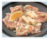
噛むほどに甘くジューシーな脂がにじみ出る『幻のホルモン』(通称マボホル)は、すぐに品切れになる程の人気メニュー。

五反田の池上線ガード下で育んできた上質を極めた焼肉の味はさすが！多くのファンが通いつめる『池上線ガード下物語』が新しく『大崎ウイズシティ』テラス3Fにオープンしました。人気の定番メニュー、カルビ、タン塩、ハラミの他、テレビでも紹介された『幻のホルモン』も絶品。手塩にかけて育てた『味わいの物語』をいま、大崎から伝えていきます。