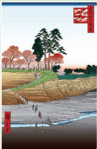
品川宿に接した高台「御殿山」は、江戸時代の代表的な花見の名所。その下を流れる目黒川から御殿山にかけて