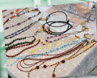
シックな高級感のネックレス