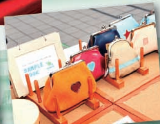
個性派ポーチも人気