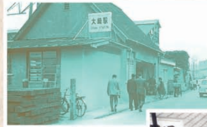
昭和30年頃の大崎駅 前通り陸橋下(当時は 鉄道を跨ぐ陸橋が存在 )のお店(下)