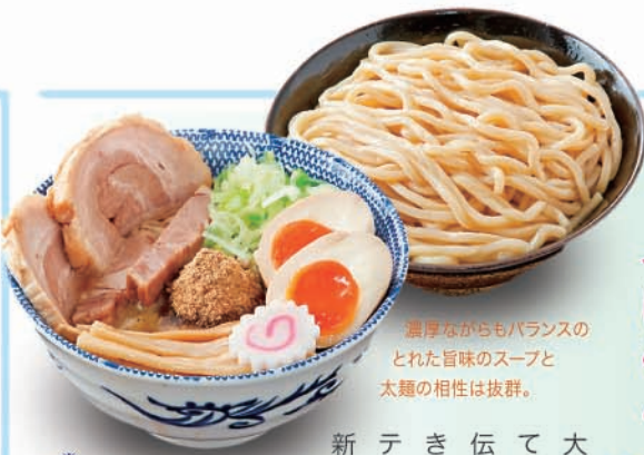
濃厚ながらもバランスのとれた旨味のスープと太麺の相性は抜群。

大崎の地で生まれ、超行列店として全国に知れ渡った、あの六厘舎。伝説のつけ麺が再び大崎に戻ってきました！『大崎ウイズシティ』テラス1Fに充実の内容を備えて新しい六厘舎がオープン。濃厚スープと太麺による、荒々しく男らしいつけめんが、発祥の地、大崎地元の味として、さらに多くの人々へその魅力を発信し続けていきます。 ※写真はWeb掲載のイメージ写真です。正式な販売商品は異なる場合があります。