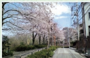
目黒川続きに、江戸の名所「御殿山の桜」を訪れるのも一興です。