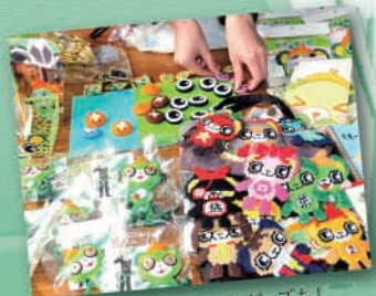
おなじみ『大崎一番太郎』グッズも!