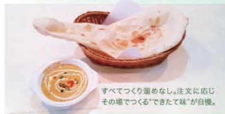
すべてつくり溜めなし。注文に応じ、その場でつくる“できたて味”が自慢。

インドカレーやナン、タンドリーチキンなどの本格的なインド料理をはじめ、ポトフなども揃えたテイクアウトショップ(ブラックエレファント)が『大崎ウイズシティテラス』1Fにオープン。とくに調理にはインド人スタッフを起用するなど、本場の味へのこだわりを追求しています。また夕方からはお惣菜も用意しています。