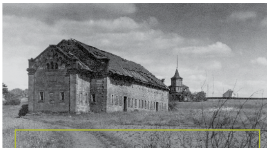
Le Fort Rubamprez et le Fort Rumigny au Fetschenhof (1930, auteur inconnu)

Rechnungsbicher vun der Stad Lëtzebuerg aus där Zäit. Op der Rumm schéngt deemools nach keng Mauer bestanen ze hunn, well et gëtt an dësen Ofrechnunge vun den Aarbechten, déi an a rondërem d' Stad gemaach goufen, net vun der Rumm geschwat. Allerdéngs geet Rieds dervun, datt op der "Dinsselen", esou huet deemools d' Rumm geheescht, e Kallekuewen an de Joren 1390 bis 1393 bedriwwen gouf an datt do wahrscheinlech dee Kallek gebrannt gouf, fir déi uewen ernimmte Schantercher ze beliwieren. Wou dës Kallekuewe genee stoung, konnt bis elo awer nach net eraus fonnt ginn. Et kann een och unhuelen, datt déi sëllege Koralle-Kallek-Steng, déi ëmmer nees op en neits op der Rumm an um Fetschenhaff fonnt ginn, aus réimescher Zäit stamen a wahrscheinlech aus den ale verfalene réimeschen Uertschafte bei Hueschtert, Duelem oder Mamer op d' Rumm bruch goufen, fir do gebrannt ze ginn.