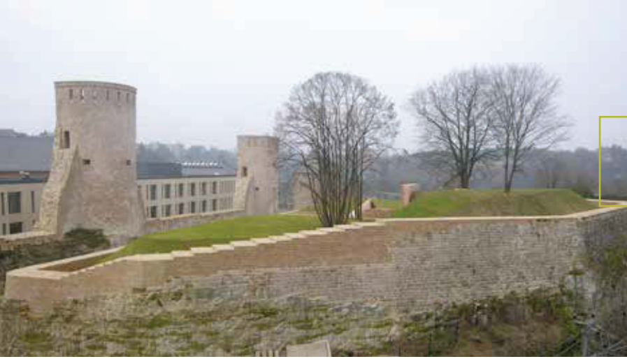
De „Ravelin du Rham“ no de Restauratiouns- aarbechten.

Wat d'Rumm betrëfft, esou hat de Vauban virgesinn, all Schied, déi duerch den Ugrëff entstane waren, ze flécken. Och de Gruef virun der „Wenzelsmauer“ gouf méi déif a méi breet gemaach an e bommeséchere Verbindungsgang (Poterne mat Kaponnière) gouf ugeluecht, dee vum Plateau bis op deen neie Ravelin verlaf ass. Dëse Ravelin, dee ganz ronderëm mat engem Gruef ëmschloss war, huet de franséischen Ingenieur virun d'„Wenzelsmauer“ baue gelooss, fir ze verhënneren, datt ee konnt mat Kanoune riicht drop schéissen.