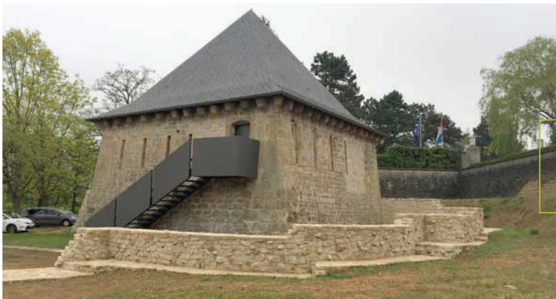
D'„Redoute de la Bombarde“ an hirem heitegen Zoustand, R. Wagner, 2017.

e Losange, deen un de Feil erënnert. En déiwe Gruef leeft ronderëm dëse Losange. Iwwert eng hëlze Bréck an duerch eng Paart kennt een an de Fort eran. Do gëtt et ënnerierdesch Kasematten, bommesécher Polvermagasénger, Wäll aus Buedem Plattformen, fir Kanounen drop ze stellen. Eng Galerie verbënnt de „Fort du Moulin“ mam Fort „Rumigny“. D'Forte „Rubamprez“ a „Rumigny“ gi moderniséiert. Hei gi Kichen a Polvermagasénger gebaut.