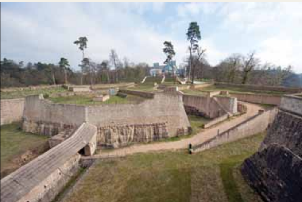
La forteresse au début du XVII e siècle