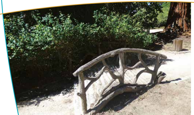
Pont typique constitué de balustres en béton

aux 40 écus, un séquoia géant, un noisetier de byzance, un sapin d'Espagne,... mais aussi pour ses massifs floraux et sa pièce d'eau. Le parc est un jardin à l'anglaise et d'agrément, il est composé d'allées sinueuses entrecoupées de petits ponts typiques constitués de balustres en béton. Il se distingue aussi par son entrée monumentale, accessible depuis l'Avenue de Strasbourg. Elle provient du porche de l'hôtel Mahuet, datant du XIII e siècle.