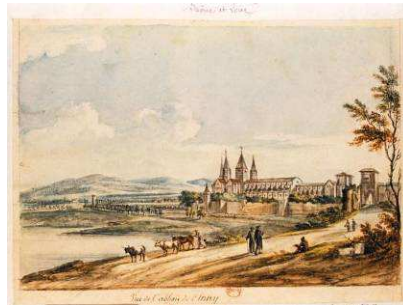
Vue de Cluny – Jean-Baptiste Lallemand 1790

En 1798, le terrain de l'abbaye est découpé et vendu par lots et devient une carrière de pierre. L'église est presque entièrement détruite, mais il subsiste sur l'ensemble du site d'importants vestiges