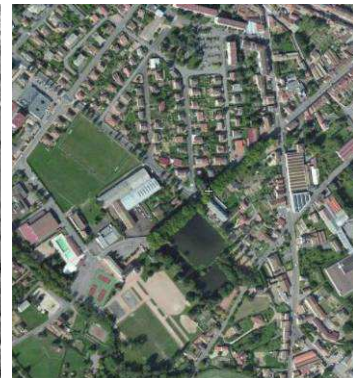
Photo aérienne 1946

Il subsiste cependant devant le château des plans d'eau, longés par l'allée plantée et entourés d'alignement arborés.