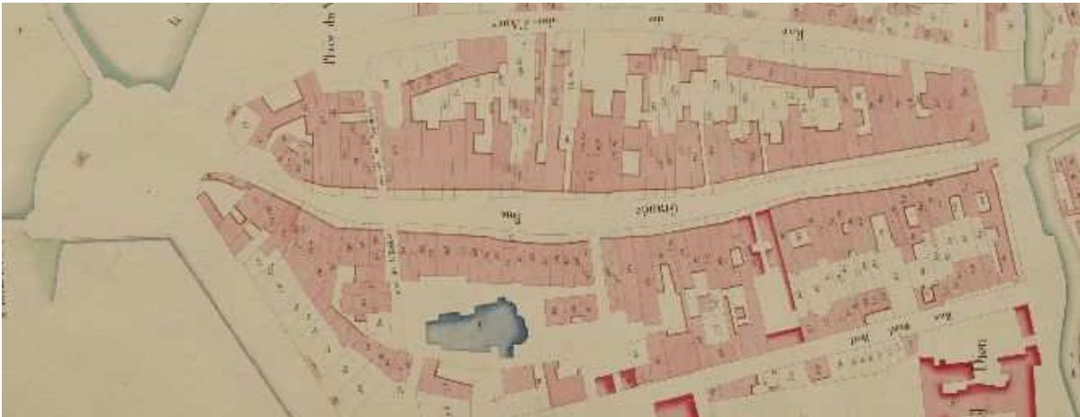
Cadastre napoléonien de 1811

En partie incendiée en 1370 par les Grandes Compagnies, la ville a été reconstruite sur la base des tracés médiévaux, aujourd'hui encore préservés.