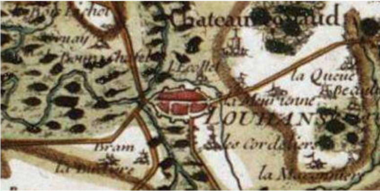
Carte de Cassini

La Grande Rue, établie sur le tracé de la voie reliant la Bourgogne au Comté et à l'Italie, constituait, dès le 13 ème siècle, le noyau de la cité de Louhans, enserrée dans une enceinte de forme oblongue. Louhans était déjà un important lieu de négoce et c'est à cette époque que les premières arcades de la Grande Rue ont été construites.