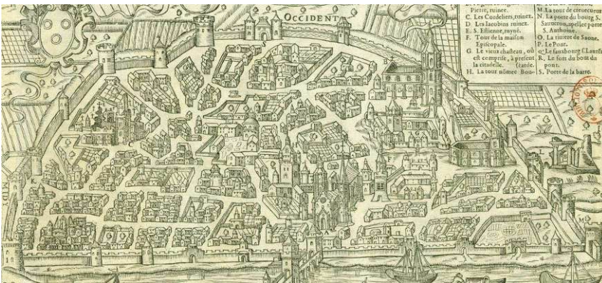
Plant & Pourtraict de la ville d'Autun » de Nicolas Chesneau de 1576

Au Moyen-Age, la ville, s'étant étendue, a été entourée au 14 ème siècle d'une nouvelle ceinture de remparts formant un demi-cercle adossé à la Saône. C'est à partir de leur démolition, dans la deuxième moitié du 18 ème siècle, que la ville s'est ouverte pleinement sur le fleuve avec l'aménagement des quais et la constitution du front de Saône, façade principale et emblématique de la ville.