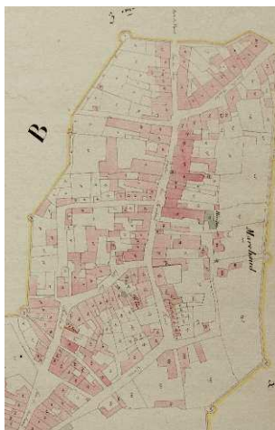
Cadastré de 1823