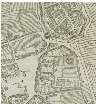
Plan de 1581

Le site inscrit porte également sur la partie de la « ville moyenne » située au sud de l'ancienne ville fortifiée.