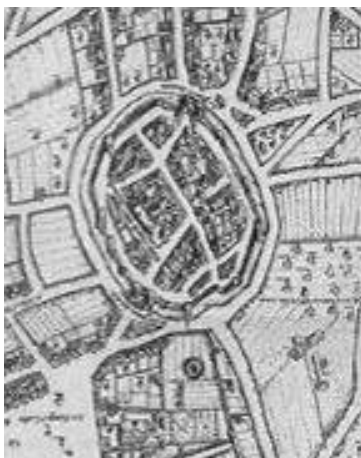
Plan de Belleforest 1875

Le cœur du site inscrit est constitué par l'ancienne ville fortifiée dite de Marchaux, ou ville basse, qui, s'est constituée à partir du 11 ème siècle à l'instigation du duc de Bourgogne et de l'abbesse de Saint-Jean, au nord de la ville ecclésiastique ou ville haute, au milieu des vestiges de la cité gallo-romaine d'Augustodunum. A vocation marchande et artisanale, la ville était ceinte de ses propres remparts.