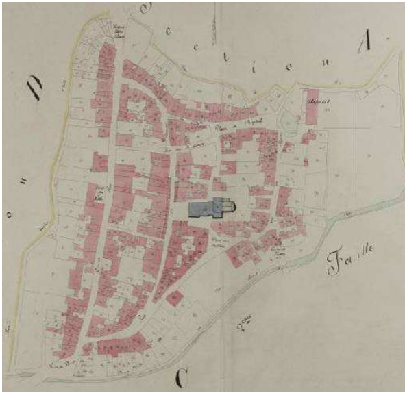
Cadastré napoléonien de 1824