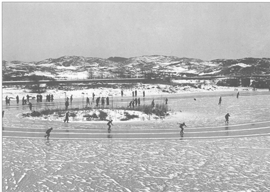
400 meter baan in 1950

Het meertje is vanaf het begin een groot succes bij schaatsers, recreanten zowel als de georganiseerde schaatssport. Dat laatste blijkt onder meer uit een brief van de schaatsbond. Daarin wordt gemeld dat men graag wedstrijden wil organiseren op het duinmeer