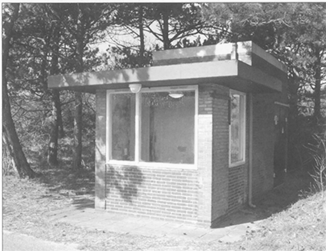
De niet meer gebruikte kassa, 2009

Hoewel de motivering voor de zandafgraving, de meertjes en het wandelpark steeds is geweest dat het voor inwoners van de gemeente een aantrekkelijk recreatieobject zou worden, moest er voor de toegang wel betaald worden. Vroeger was het laten betalen voor recreatievoorzieningen een onderdeel van het gemeentelijke beleid van Bloemendaal. Dat verklaart de nog steeds aanwezige kassa voor de verkoop van toegangskaartjes, nu een merkwaardig overblijfsel uit een lang vervlogen tijd. De kaartverkoper in het Wethouder Van Geluk-