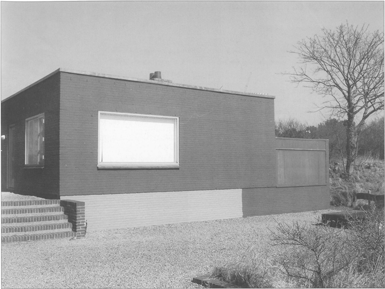
Voormalig woonhuis met rechts de dichtgeschroefde 'zopie', 2009