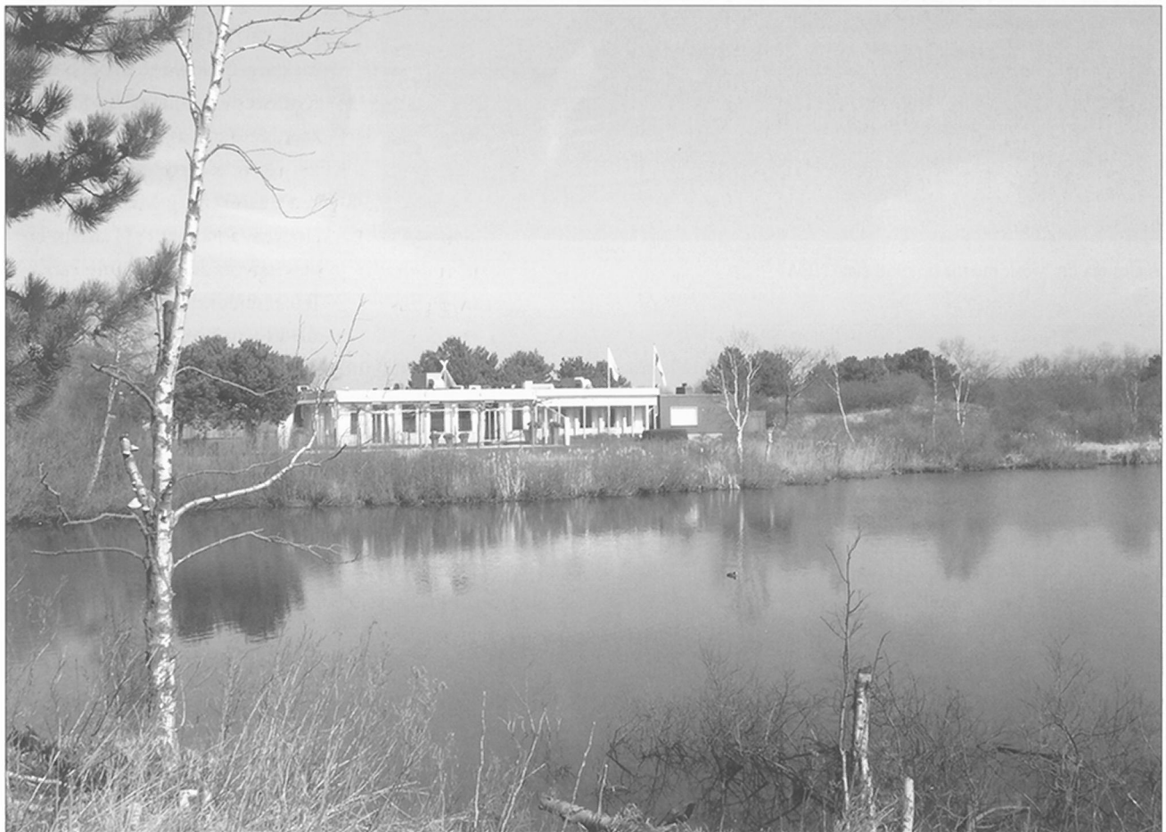
Restaurant De Bokkedoorns, 2009