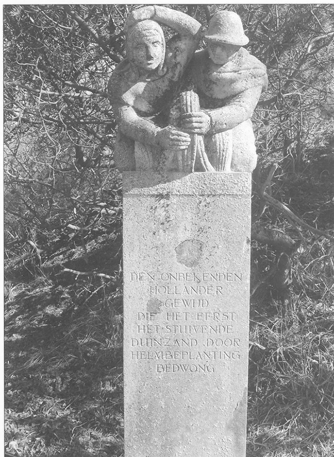
Helmonument, 2009