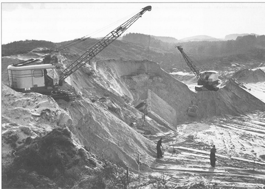
Aanleg van het tweede meertje in 1960

Oorspronkelijk was slechts sprake van één meertje. Later komt daar in zuidelijke richting een tweede bij. Vooral het succes van het schaatsen werkt mee aan het idee de ijsvloer te vergroten. Tegelijk speelde een andere gedachte: het bouwen van een theehuis. Dat plan leefde eveneens bij de raadsleden en werd onder meer bepleit door wethouder mevrouw M.E. Nolte. De gemeente Bloemendaal had al 'uitspanningen' in eigendom waar de gewone man thee, koffie, bier of ranja kon drinken en een ijsje eten. Net als het pannenkoekenhuisje in het Bloemendaalse bos en het theehuis in het Brouwerskolkpark, moest ook het Wethouder Van Gelukpark een dergelijke horecavoorziening krijgen, zo was de gedachte van de raadsleden.