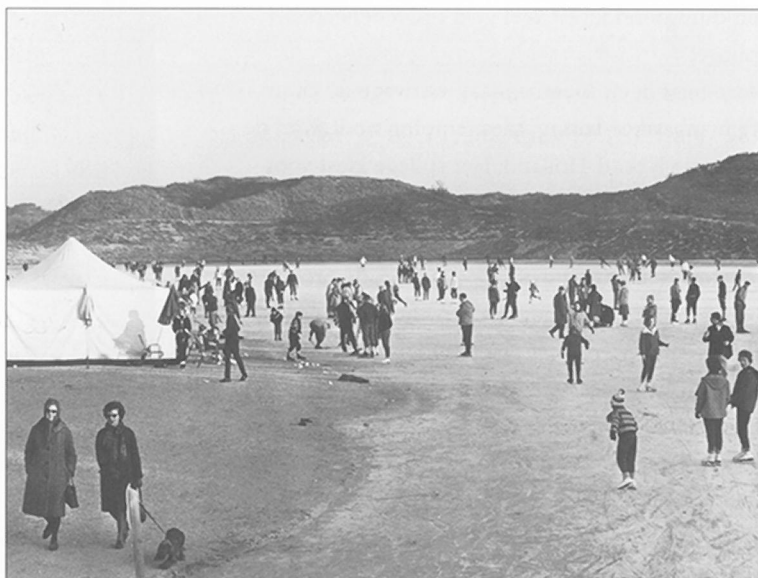
Ijspret in 1963

'ter verrijding van provinciale en eventueel zelfs nationale kampioenschappen'. Ook de raadsleden hebben positieve ervaringen met het natuurijs op het aangelegde meertje. De Jong Schouwenburg en andere raadsleden melden dat zij er op de schaats hebben gestaan. Bestuurlijk Bloemendaal ziet de waarde van een 400 meter wedstrijd baan. Men droomt al van Europese schaatskampioenschappen. Zo ver is het overigens nooit gekomen. De ijsbaan krijgt in de loop der jaren vooral een sterk recreatief karakter. Maar wat het college en vooral wethouder Van Geluk bestuurlijk hadden voorzien, kwam uit. Bij zijn afscheid als wethouder van Bloemendaal in de raadsvergadering van 21 augustus 1958 wordt de 'zandkuil' omgedoopt tot Wethouder Van Gelukpark, een naam die nog steeds bij de ingang te vinden is.