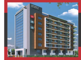
REGENCY HOSPITAL GOVIND NAGAR