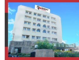
REGENCY HOSPITAL | TOWER-1 SARVODAYA NAGAR