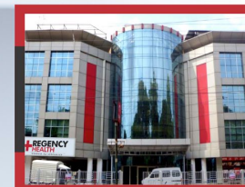
REGENCY RENAL SCIENCES CENTRE