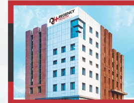
REGENCY HOSPITAL | TOWER-2 SARVODAYA NAGAR

| SUPER SPECIALITY OPD & DIAGNOSTIC CENTRE |