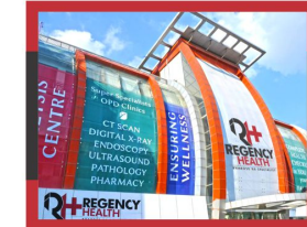
REGENCY CITY CLINIC P. P. N. MARKET, KANPUR

| SUPER SPECIALITY OPD & DIAGNOSTIC CENTRE |