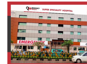
REGENCY HOSPITAL LUCKNOW