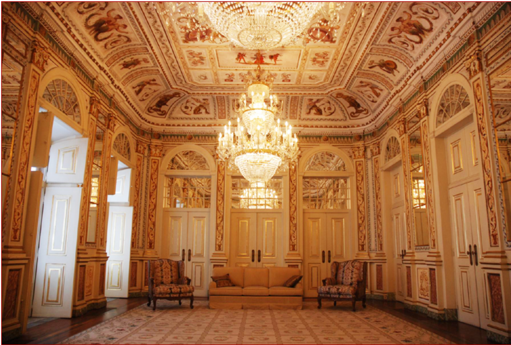
Figura 11 Visualização geral da Sala de Baile do Palácio Porto Covo [Em linha]. [Consultado 20.10.2016]. Disponível na internet: http://www.casaruibarbosa.gov.br/acasasenhorial/ .

doiradas: o tecto é ovado, e d'elle pendem dois lustres de dez luzes cada um, e do mesmo artifício, e riqueza que os outros 65 (ver Figura 11).