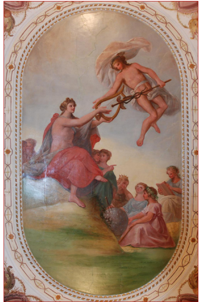
Figura 12 Pormenor dos deuses Apolo, Mercúrio e as musas de Cyrillo Volkmar Machado. Fotografia da autora, 2013.

e pequenos; porém todos de auctor conhecido, e celebre; colocados em simetria, e capazes de divertir muito tempo a qualquer entendimento hábil” 66 . Além das pinturas, a sala era composta de “excelentes cadeiras de pau magno com almofadas de damasco verde; e duas bancas, uma defronte da outra com um relógio, e em ambas várias peças preciosas de loiça da India” 67 . No Catálogo dos Objectos de Arte... , citado anteriormente, existem descrições de inúmeras peças que podem corresponder às descrições de Ignácio Menezes – seria uma tarefa