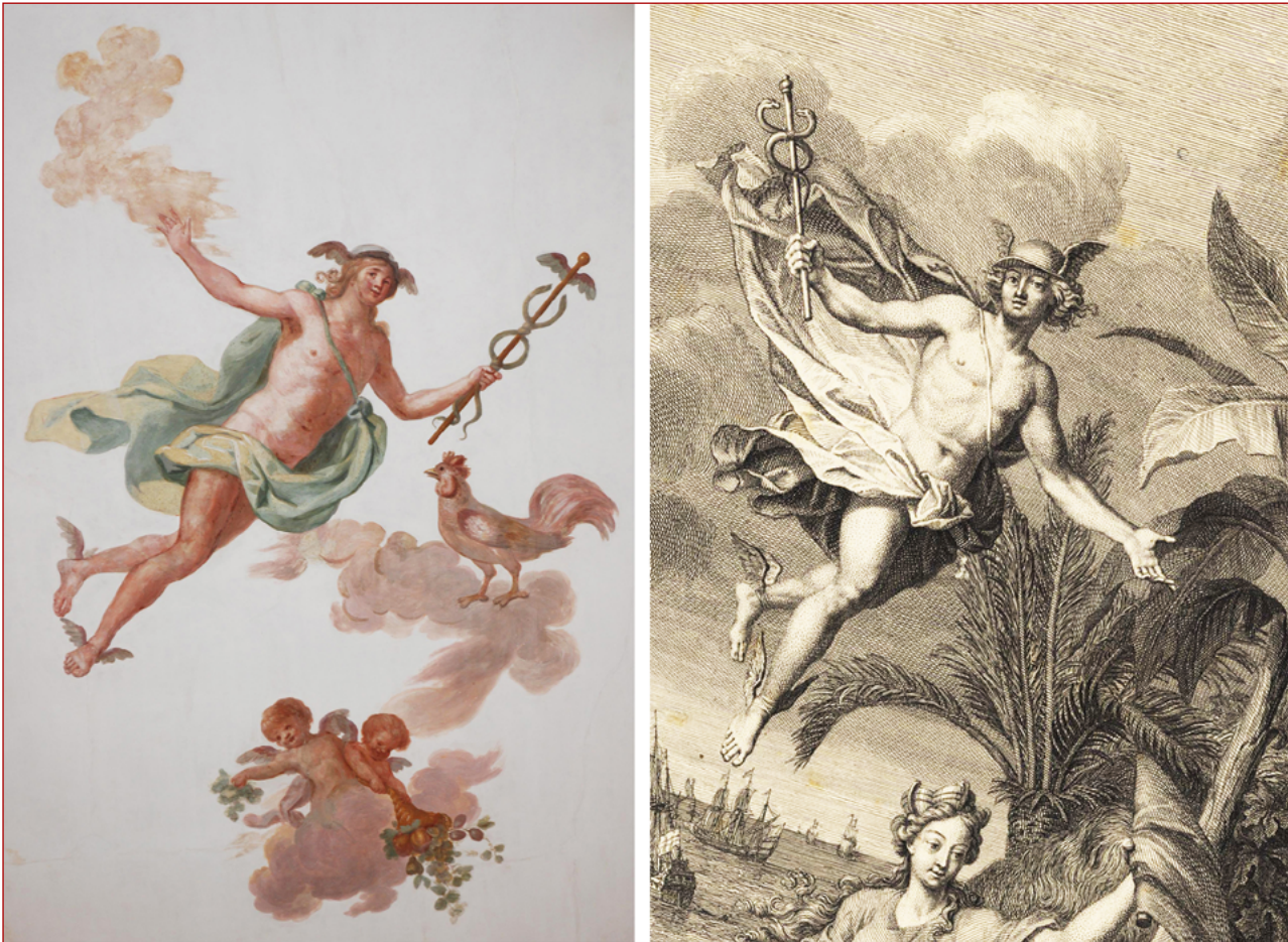
Figuras 6 e 7 Deus Mercúrio na pintura de teto da Sala de Recepção do palácio Porto Covo (fotografia da autora, 2013), realizada a partir de gravura de Bernard Picart. In / Asie & ses parfums, les trésors de l’Afrique, et de l’une & autre Amerique , 1719.

A escolha iconográfica aponta para ligações com a academia francesa de Roma, muito provavelmente desde os seus tempos de permanência nesta cidade. Esta academia teve um papel decisivo e influente na vida artística em Roma aquando da sua fundação em 1666, promovendo obras que divulgavam o lastro deixado pela cultura greco-romana. A admiração pelos artistas relacionados com a Academia de França em Roma é percecionada através do seu Tratado de Simetria : “Poussin, Le Brun, Le Seur, Mignarde, foram mestres que transferirão à França o gosto da Itália e dos antigos” 54 .