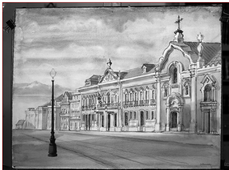
Figura 1 Palácio dos Viscondes de Porto Covo da Bandeira [Em linha]. Fotografia do estúdio de Mário Novais da aguarela do pintor inglês David Ponsonby, datada de 1968. Lisboa: Arquivo Municipal de Lisboa (AML), PT/AMLSB/CMLSBAH/PCSP/004/MNV/001334.

Não existe qualquer tipo de documentação que comprove o nome do arquiteto envolvido, mas, e segundo José Romão, este atribui o risco do palácio a “Joaquim de Oliveira e não Manuel Caetano de Sousa como durante muito tempo se admitiu” 18 . Baseia esta sua pesquisa na verosimilhança arquitetónica entre o frontão da capela do palácio Porto Covo e a igreja Nossa Senhora Jesus (igreja paroquial das Mercês). De fato, numa nota manuscrita de Honorato José Correia de Macedo e Sá, e na entrada referente a Joaquim de Oliveira diz-se assim: “he seo o desenho do frontispício da igreja de Jesus, e todo o convento por ele reformado” 19 . Apesar das notórias semelhanças entre a capela do palácio Porto Covo e a igreja de Nossa Senhora de Jesus, importa salientar que, a título de exemplo, a igreja de Corpus Christi , na rua dos Fanqueiros, apresenta igualmente um frontão contracurvado encimado por fogaréus, decorrente das obras de reconstrução empreendidas pelo arquiteto do Senado, Remígio Francisco de Abreu, após o terramoto de 1755. É por isso difícil definir o arquiteto do palácio Porto Covo sem base documental. Uma coisa é certa: é um palácio com reminiscências fortemente vinculadas a um formulário de cariz barroquizante, muito na senda de Manuel Mateus Vicente, “traindo uma tradição que ainda não tinha morrido completamente” 20 .