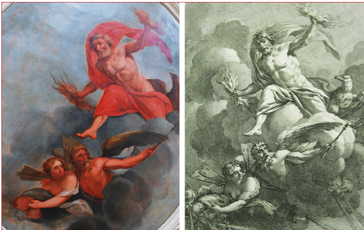
Figuras 4 e 5 Pintura de teto da escadaria do palácio Porto Covo, realizada a partir de gravura de Michel Dorigny de uma pintura de Simon Vouet. In VOUET, Simon; DORIGNY, Michel – Porticus bibliothecae illustrissimi. Segurerii Galliae Cancellarii a Simone Vouët pictore regio depicta , Paris: [s.n.], 1640.

(fundada em 1648) 42 , como Pierre Charles Tremolières. Na generalidade, este método era seguido pelos pintores de História (veja-se o caso de Nicolas Poussin) e pressupunha o conhecimento de inúmeras fontes gravadas, pois era o meio por excelência do método de criação artística em Portugal. O país confrontava-se com a inexistência de um ensino académico estruturante, bem como das obras de pintores consideradas casos de estudo nas melhores academias europeias, pois promoviam a “fecunda imaginação” 43 .