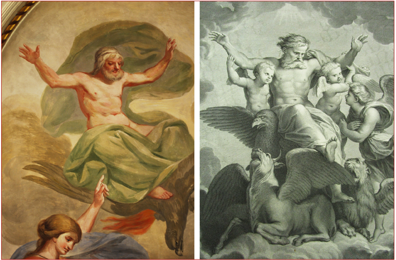
Figuras 9 e 10 Pormenor do deus Júpiter no teto da Sala de Visitas do palácio Porto Covo, de Cyrillo Volkmar Machado, realizado a partir de gravura de Nicolas Larmessin, da pintura de Rafael Sanzio A visão de Ezequiel . In BASAN, François – Recueil d'estampes d'après les plus beaux tableaux et d'après les plus beaux desseins qui sont en France . Paris: Chez Basan, 1763. tome premier.

Isócrates, até à época de Cícero, Horácio, Diodoro da Sicília (...). A reputação de Parrásio acompanhou a cultura antiga desde sempre. E o que é mais importante é que não só as suas obras são descritas, mas a sua arte e técnica são igualmente caracterizadas, assim como em períodos posteriores os seus desenhos foram utilizados como modelos para os artistas 57 .