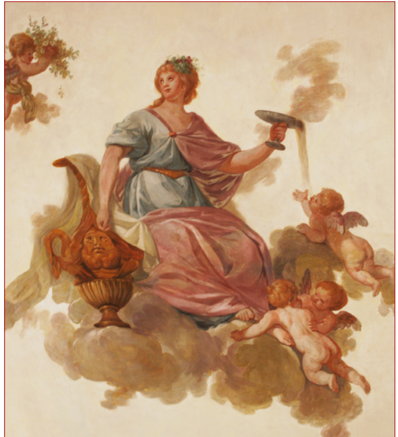
Figura 14 Pormenor da deusa Hebe de Cyrillo Volkmar Machado Fotografia da autora, 2013.

pinturas. Nas Reflexões que o artista escreve em 1793, ele encontra-se, de certa forma, já bastante decepcionado com o panorama artístico de finais de Setecentos, referindo que ficou odiado por um conjunto de arquitetos da sua altura 74 . Poderá tudo isto ter influenciado o artista? Talvez nunca se encontre uma resposta plausível, mas é bastante provável que se escondam as mesmas motivações aquando da sua nomeação como pintor de sua “Alteza Real”, para o palácio de Mafra em 1796, pela qual ele tanto lutou.