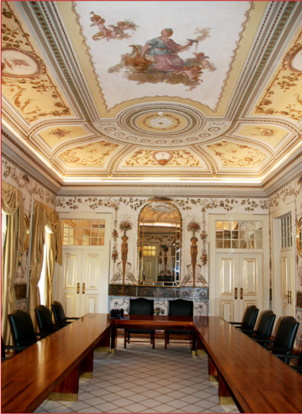
Figura 13 Visualização geral da Sala de Jantar do Palácio Porto Covo [Em linha]. [Consultado 20.10.2016]. Disponível na internet: http://www.casaruibarbosa.gov.br/acasasenhorial/ .