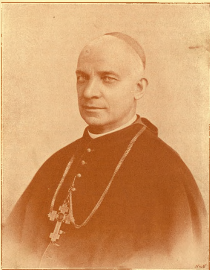
Kn. Jan Maurycy Paweł Puzyna kardynał książę biskup krakowski