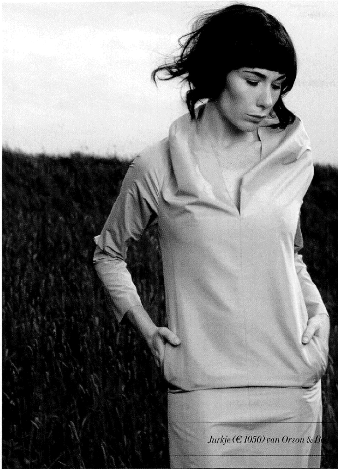
Jurkje (€ 1050) van Orson & Bodil