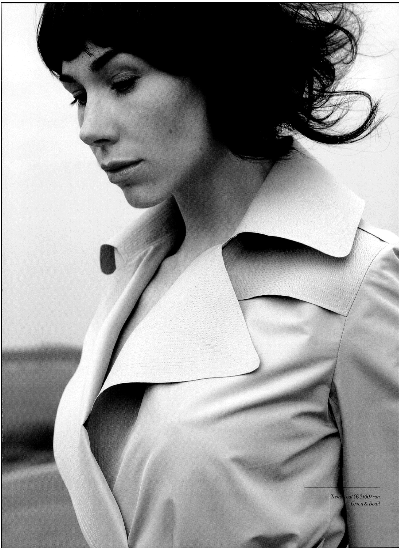
Trench coat (€2100) van Orson & Bodil