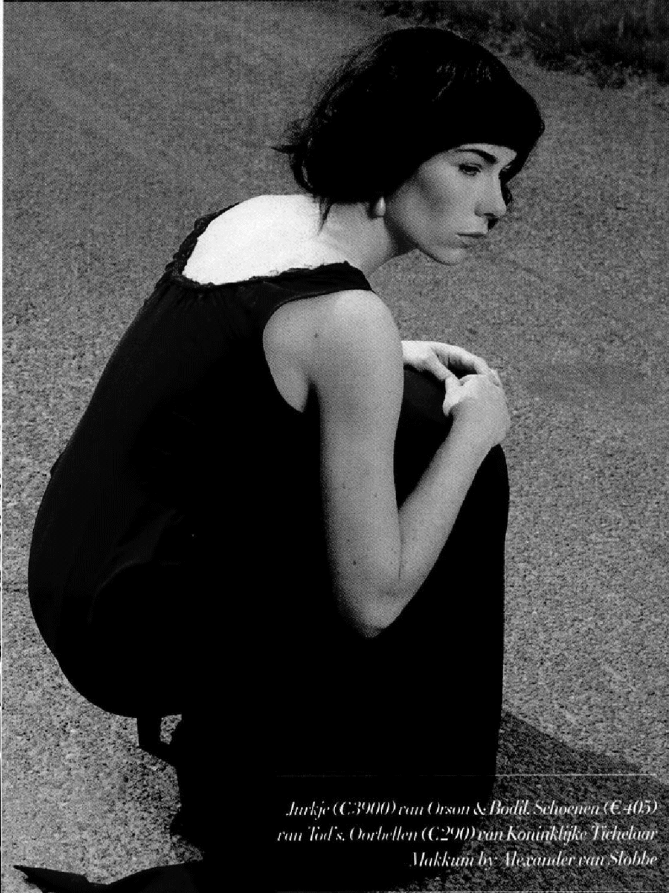
Jurkje (€ 3900) van Orson & Bodil. Schoenen (€ 405) van Tod's. Oorbellen (€ 290) van Koninklijke Tichelaar Makkum by Alexander van Stobbe