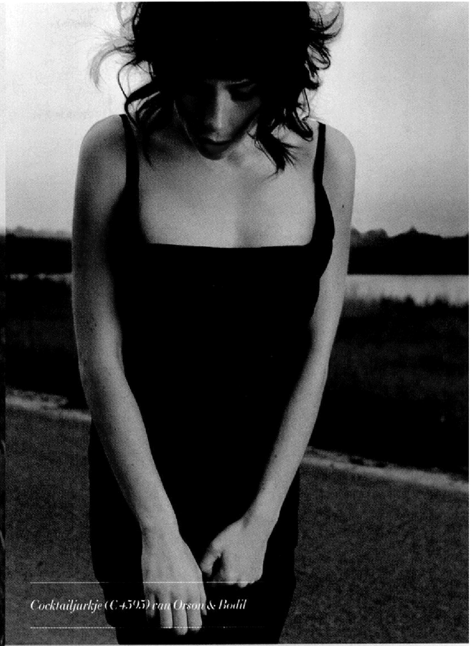
Cocktailjurkje (€ 459,5) van Orson & Bodil